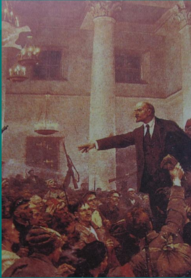
Лидер большевиков Владимир Ильич Ленин.

2 марта 1917 года, подписав манифест об отречении от престола в пользу своего брата Михаила Александровича, Николай II отправился в Могилев, чтобы попрощаться с армией. В дороге не было никаких инцидентов, внешне Николай Александрович был совершенно спокоен. По прибытию в Могилев ему сообщили, что брат Михаил отрекся от прав на престол (в конце концов, власть перешла в руки большевиков).