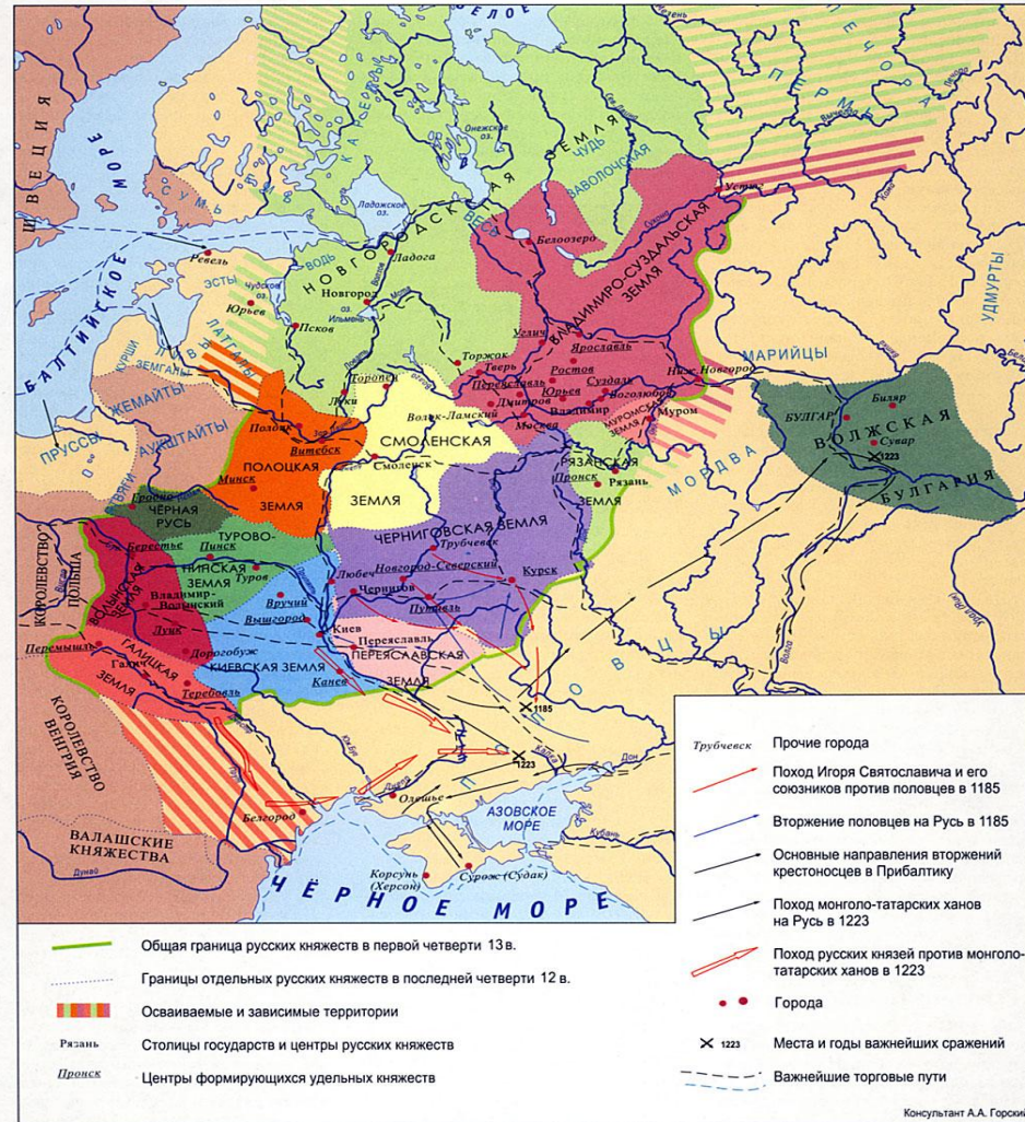
РАЗДРОБЛЕННОСТЬ РУСИ В 12 — 1-й ЧЕТВЕРТИ 13 в.