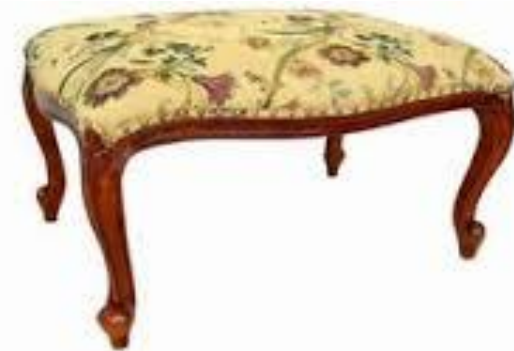
FOOTSTOOLS LG 13007