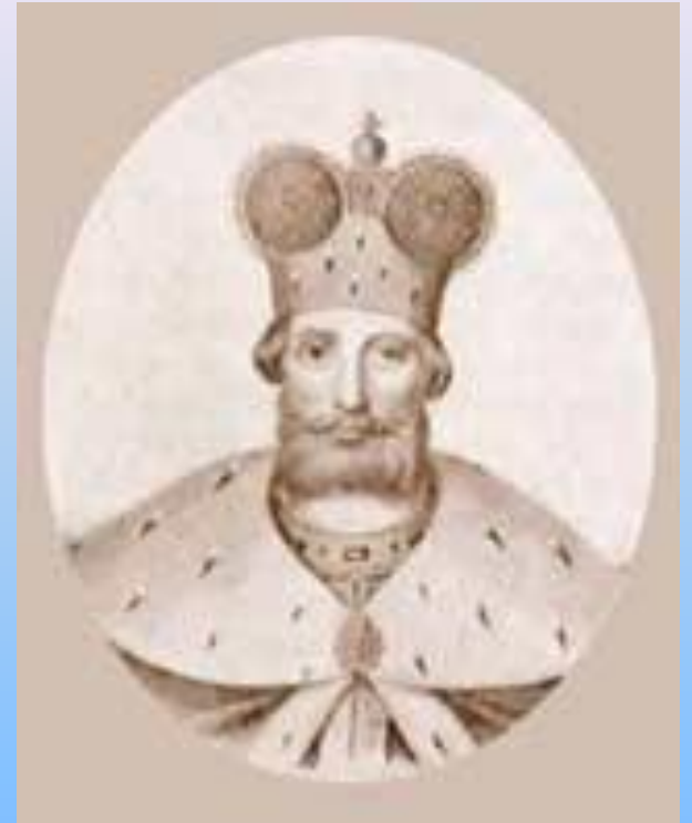
Ярослав II Всеволодович, отец Александра

родился в ноябре 1220 года (по другой версии 30 мая 1220 года) в семье князя Ярослава II Всеволодовича и рязанской княгини Феодосии Игоревны.