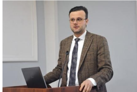
Віктор Галасюк народний депутат України, голова Комітету Верховної Ради України з питань промислової політики та підприємництва