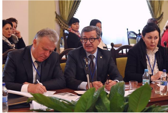
Сергій Тарута Голова наглядової ради Інституту глобальних трансформацій, народний депутат України