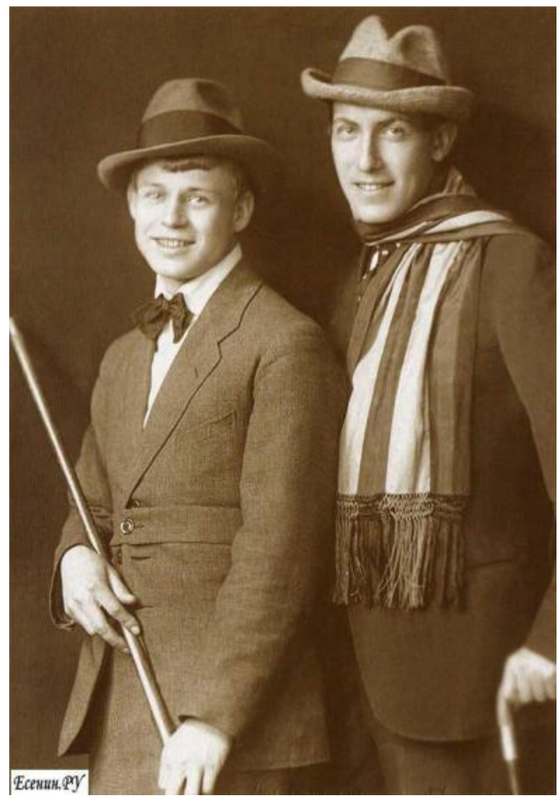
С. А. Есенин, А. Б. Мариенгоф. 1919 г. Москва.