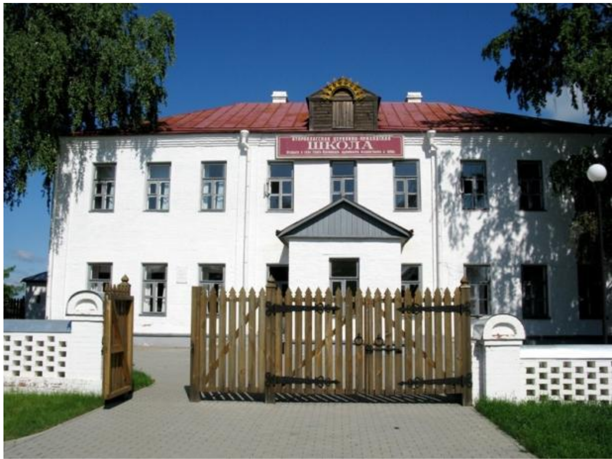
Спас-Клепиковская второклассная церковно-приходская учительская школа