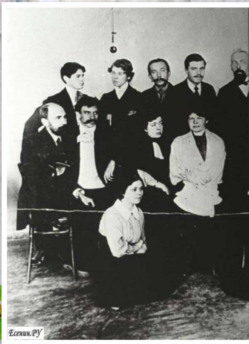
С. А. Есенин в группе работников типографии «Товарищество И. Д. Сытина» 1914 г. Москва.