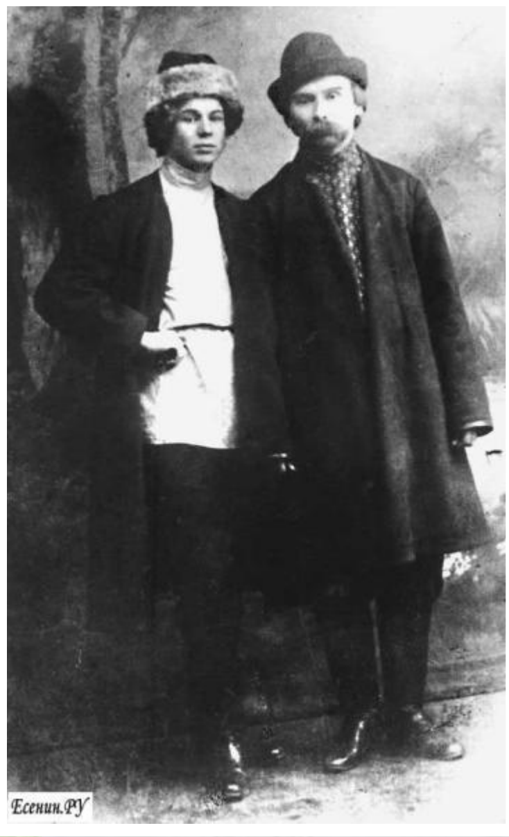
С. А. Есенин, Н. А. Клюев. Фото. 1915 - 1916. Петроград.