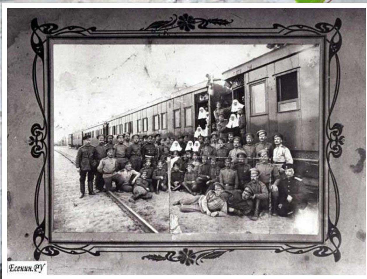
С. А. Есенин (на переднем плане) среди персонала полевого Царскосельского военно-санитарного поезда № 143. 1916 г., июнь. Черновцы.