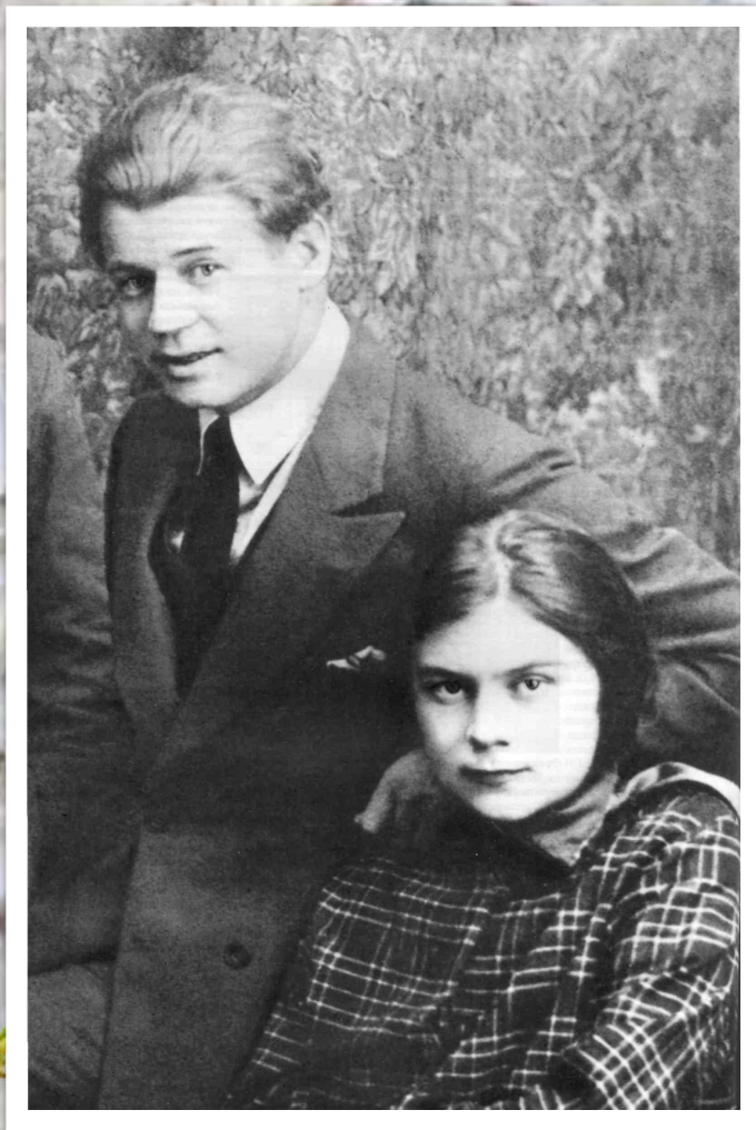
Софья Андреевна Толстая и Сергей Александрович Есенин