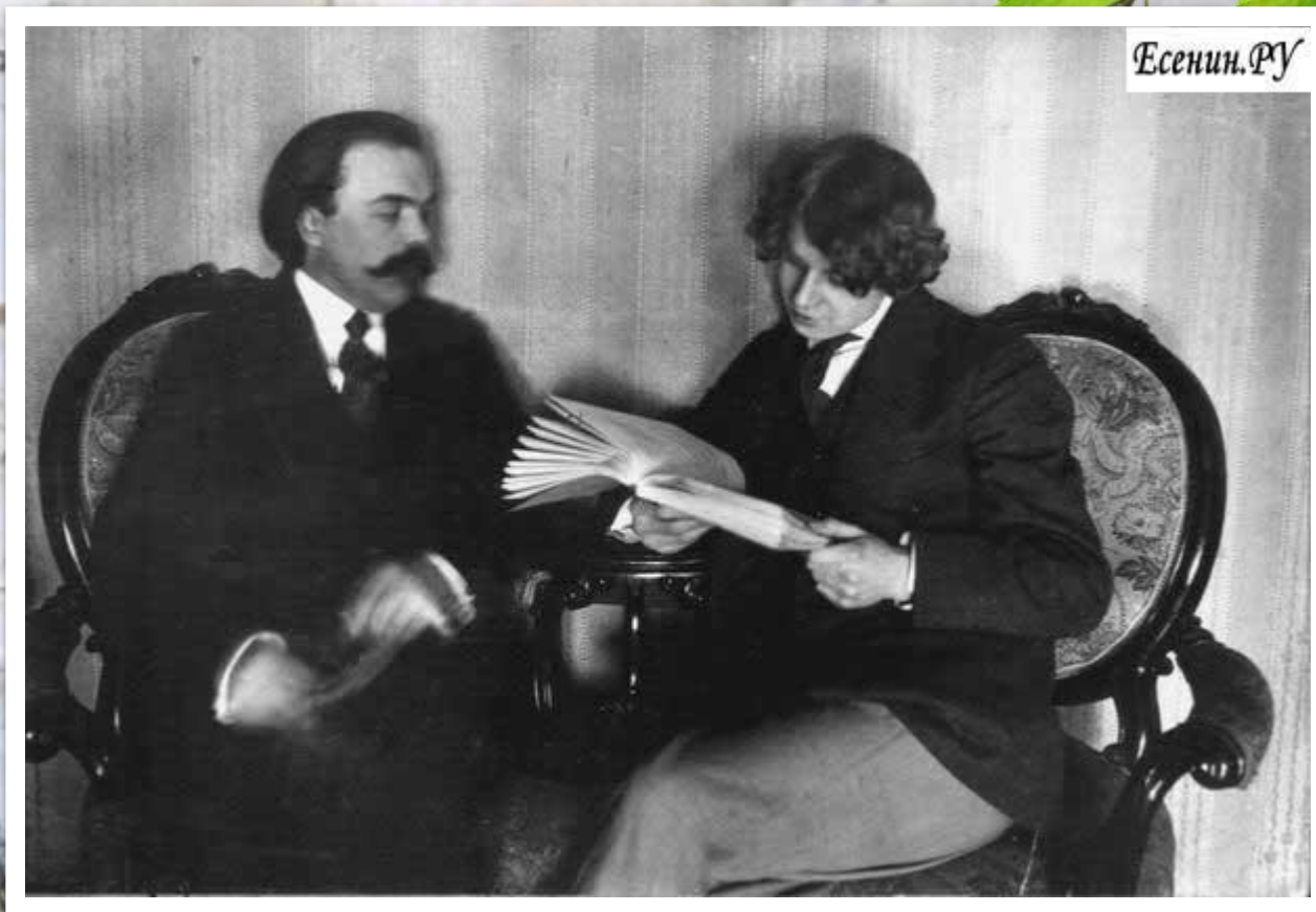
С. А. Есенин, М. П. Мурашёв. Фото. 10 апреля 1916 г. Петроград.