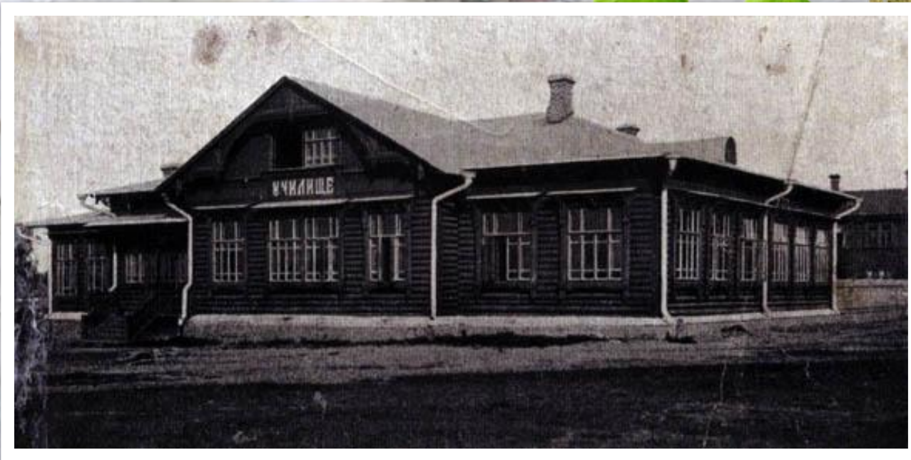
земское четырехклассное Константиновское училище