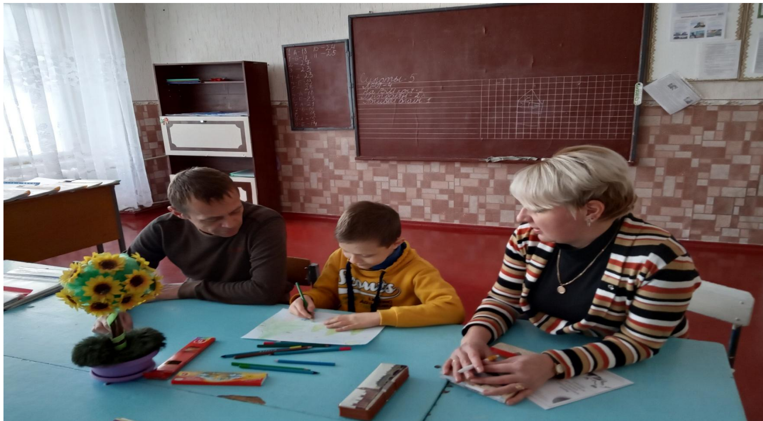
Занятие с психологом «Крепка семья ладом»