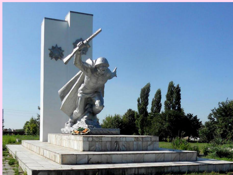
с. Воронежская (Краснодарский край)