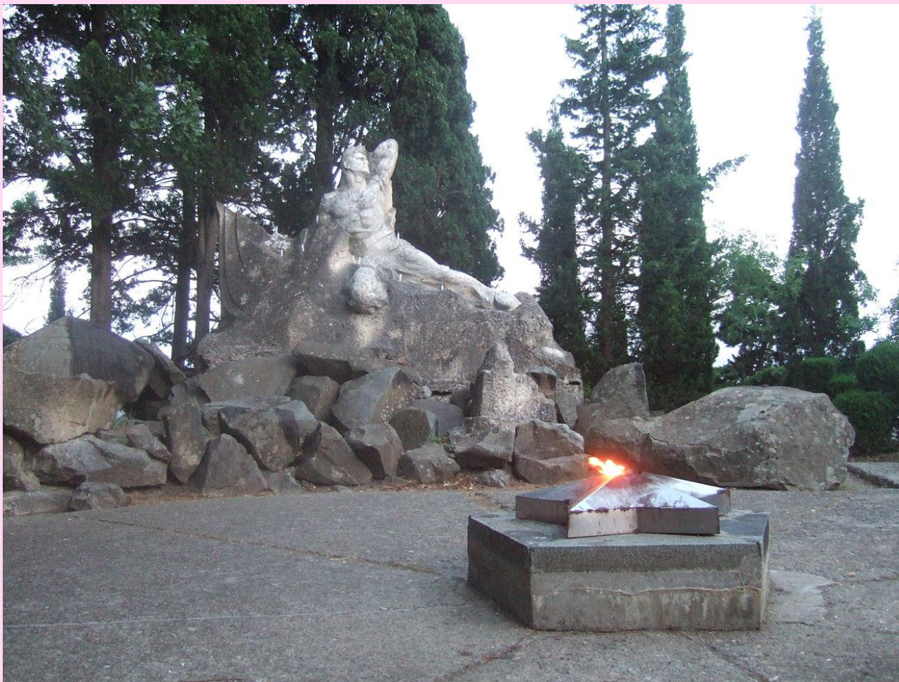
Памятник Неизвестному матросу (Крым, МДЦ «Артек»)

Установлен на могиле матроса, погибшего в 1943 году в бою с фашистами.