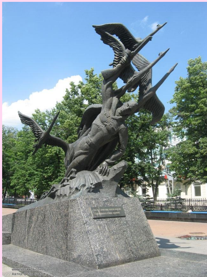
г. Луганск (Украина)