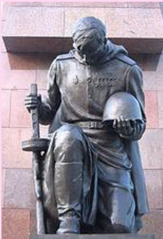
г. Берлин (Германия)