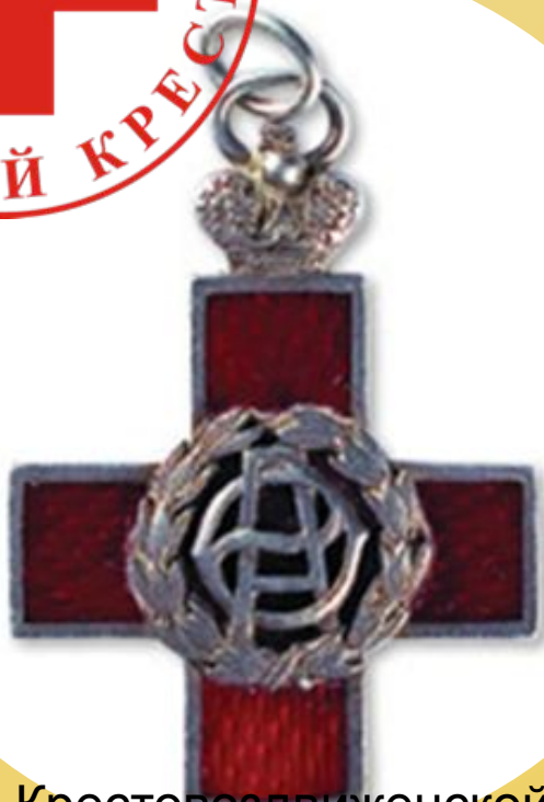
Жетон Крестовоздвиженской общины сестер милосердия Красного Креста