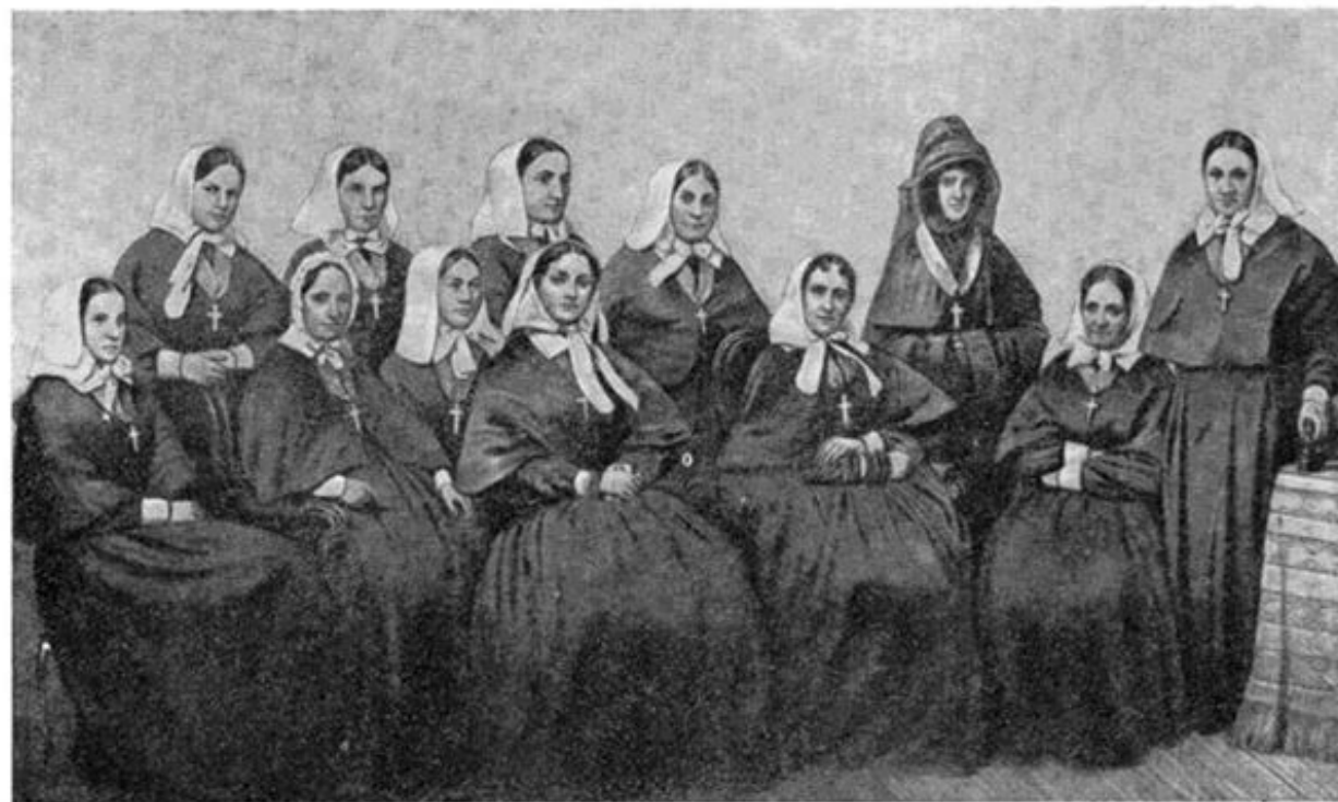
Группа сестер милосердия Крестовоздвиженской общины, участвовавших в обороне Севастополя.