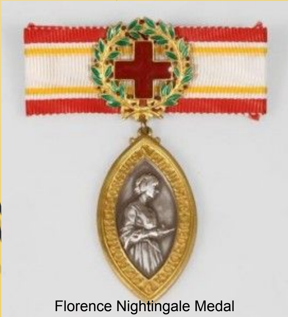
Florence Nightingale Medal