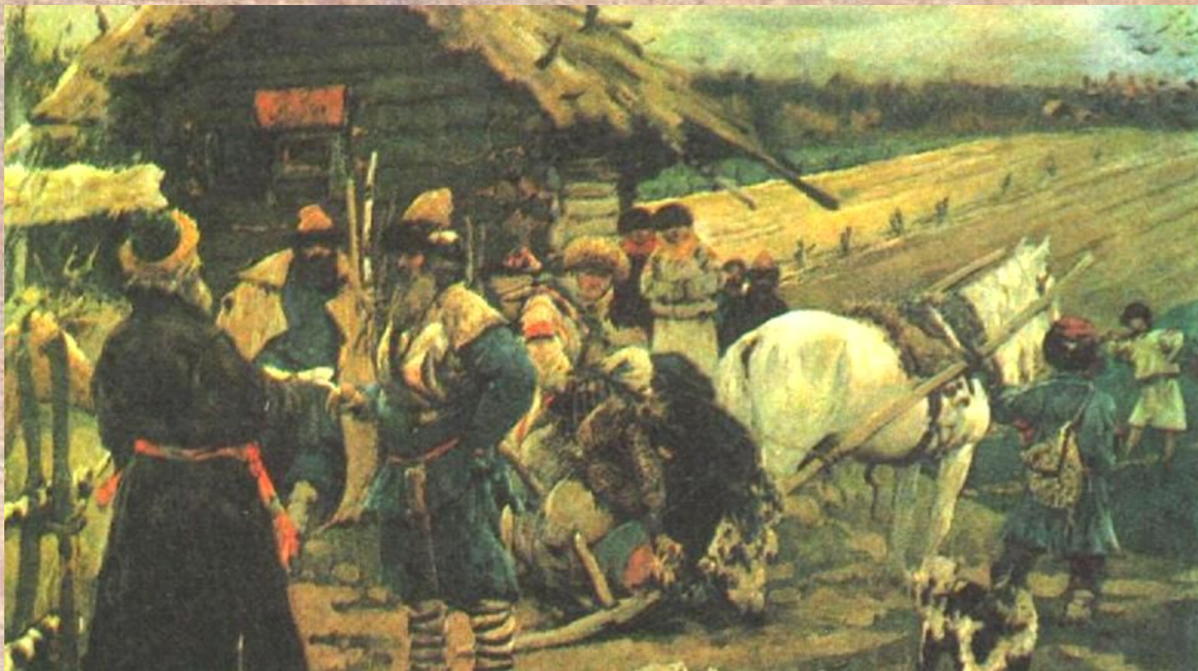
С. Иванов. Юрьев день

1497 г. – принят общий для всей страны Судебник