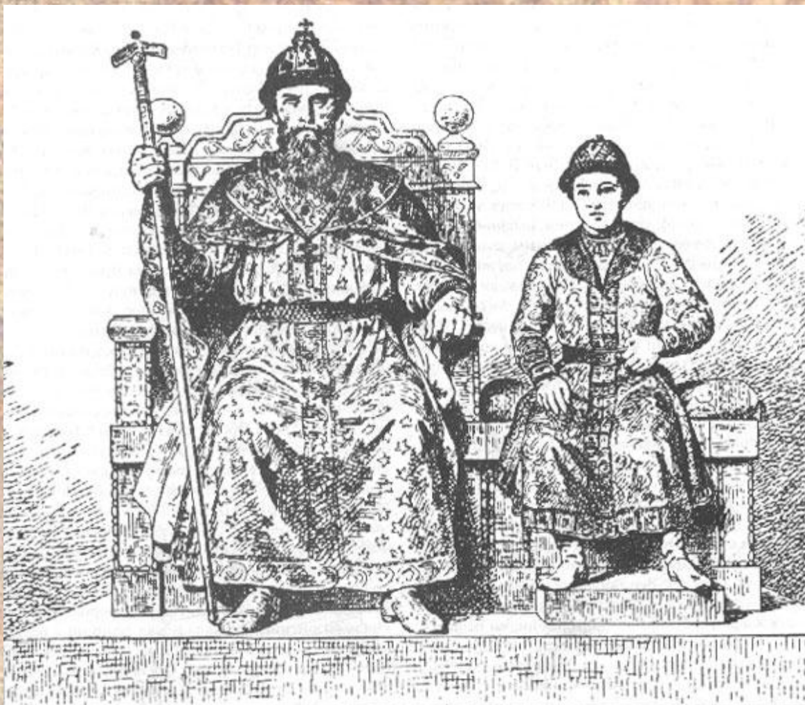
«Василий II Темный и его сын Иван» Неизвестный автор

Василий II понимал все опасности конкурентной борьбы за власть в Московском княжестве.