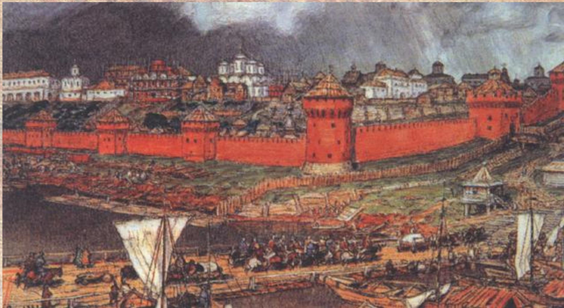
Васнецов А.М. «Московский Кремль при Иване III»