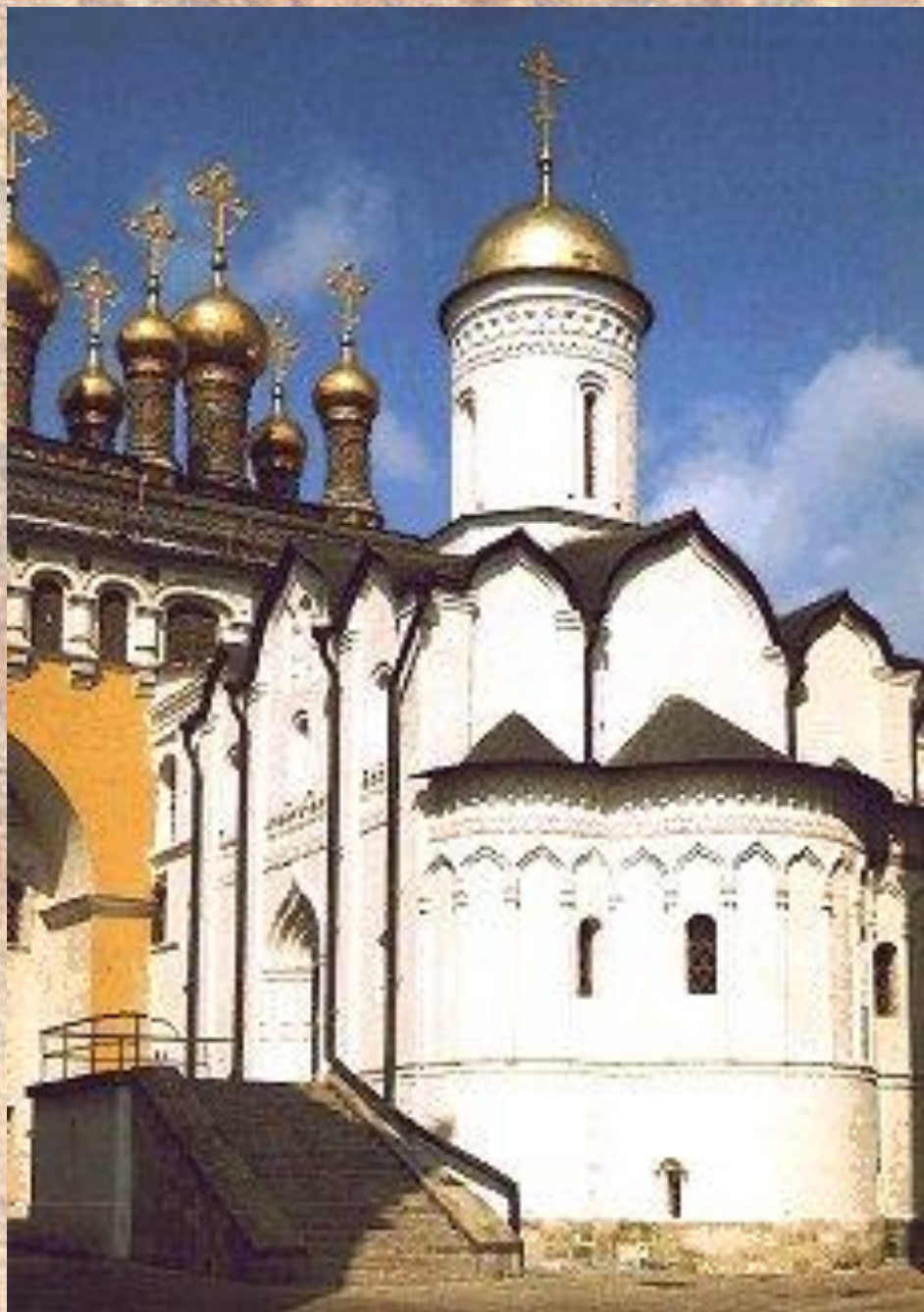
Церковь Ризположения (положения риз пресвятой Богородицы)