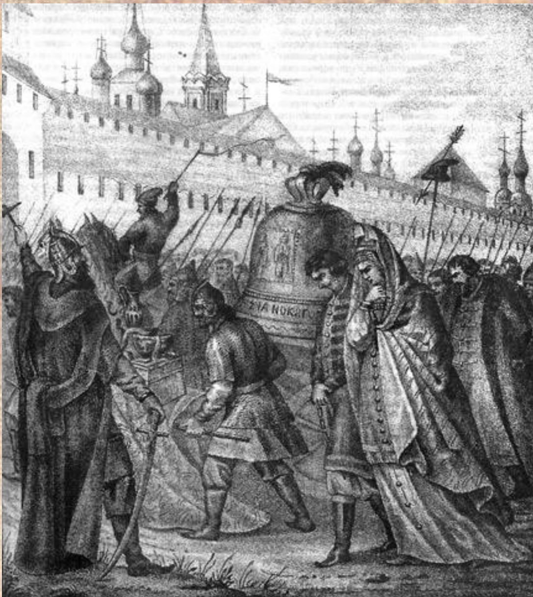
Чориков Б. «Уничтожение республики Новгородской»