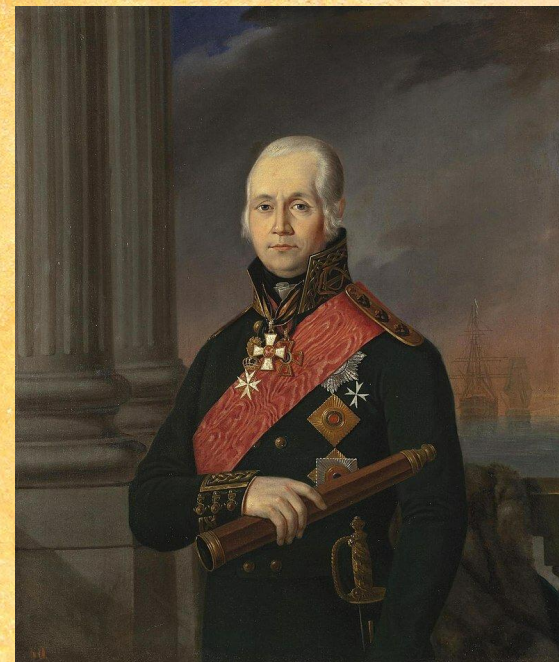
Адмирал Ф.Ф. Ушаков

В русско-турецкой войне 1787-1791 годов русским сухопутным силам успешно содействовал Черноморский флот под командованием контр-адмирала Федора Ушакова. Всего эскадра контр-адмирала Ф. Ф. Ушакова имела 10 линейных кораблей (из них только 5 больших), 6 фрегатов, 17 крейсерских судов, бомбардирский корабль, репетичное судно и 2 брандера (всего 826 орудий). Турецкий флот капудан-паши Хусейна – 14 больших линейных кораблей, 8 фрегатов и 23 мелких судна (всего 1400 орудий).