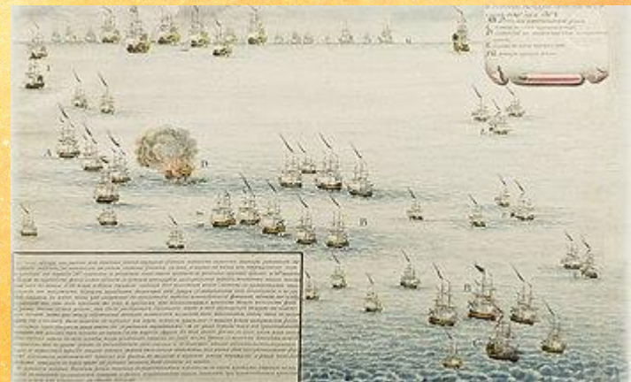
Ход боя на картине конца 18 века.

В результате напряженного боя 7 турецких кораблей сдались, остальные спаслись бегством.