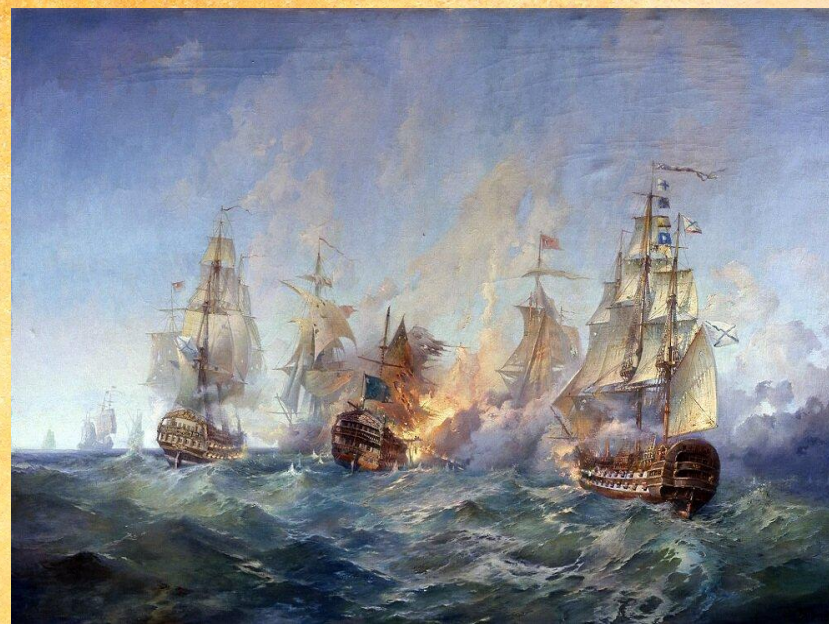
Сражение у мыса Тендра. А.Блинков. 1955 г

11 сентября отмечается День воинской славы России – День победы русской эскадры контр-адмирала Федора Ушакова над турецкой эскадрой у мыса Тендра, которое произошло 28—29 августа (8—9 сентября) 1790 года. Памятный день был учрежден Федеральным законом № 32-ФЗ от 13 марта 1995 года «О днях воинской славы и памятных датах России».