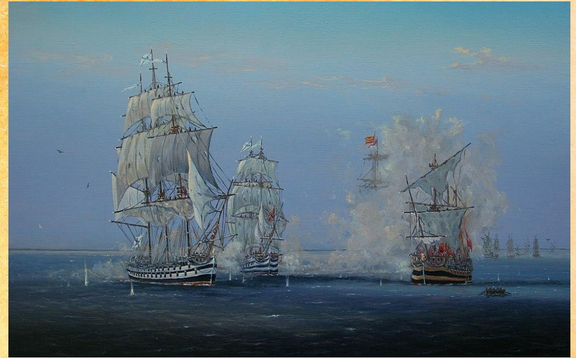
В.Косов. Сражение у мыса Тендра. 1790 г. Ф. Ф.Ушаков

В Севастополе эскадре Фёдора Ушакова была устроена торжественная встреча. Русский Черноморский флот одержал над турками решительную победу и внёс значительный вклад в общую победу. Северо-западная часть Чёрного моря была очищена от ВМС врага, и это открыло доступ в море кораблям Лиманской флотилии, при содействии которой русские войска взяли крепости Килия, Тульча, Исакчи и, затем, Измаил. Ушаков вписал в морскую летопись России одну из её блестящих страниц. Турецкий флот перестал господствовать в Черном море.