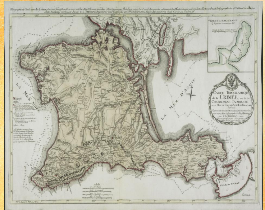
Карта Российской Империи – Крым. 1788 г

В ходе русско-турецкой войны 1768-1774 годов к России был присоединен Крымский полуостров. Россия начинает создание Черноморского флота и соответствующей прибрежной инфраструктуры. Порта жаждала реванша, кроме этого, британцы и французы, опасаясь закрепления России в Причерноморье и выхода в Средиземное море, подталкивали турецкое правительство к новой войне с русскими.