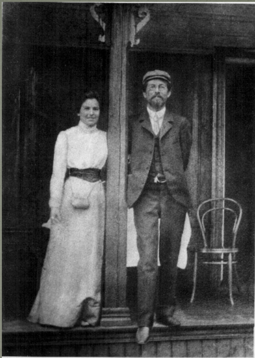
Ялта. А. П. Чехов и О. Л. Книппер. 1901 г.