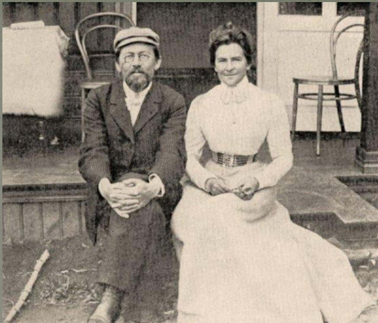
Чехов и Книппер.