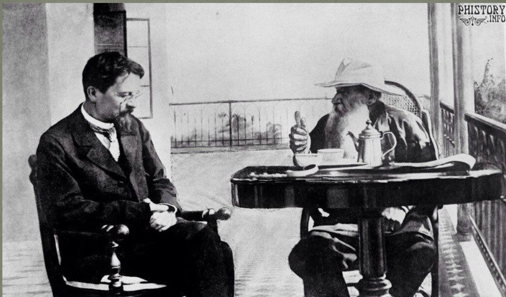
Антон Чехов и Лев Толстой. Крым. Таврическая губерния. 1900 год.