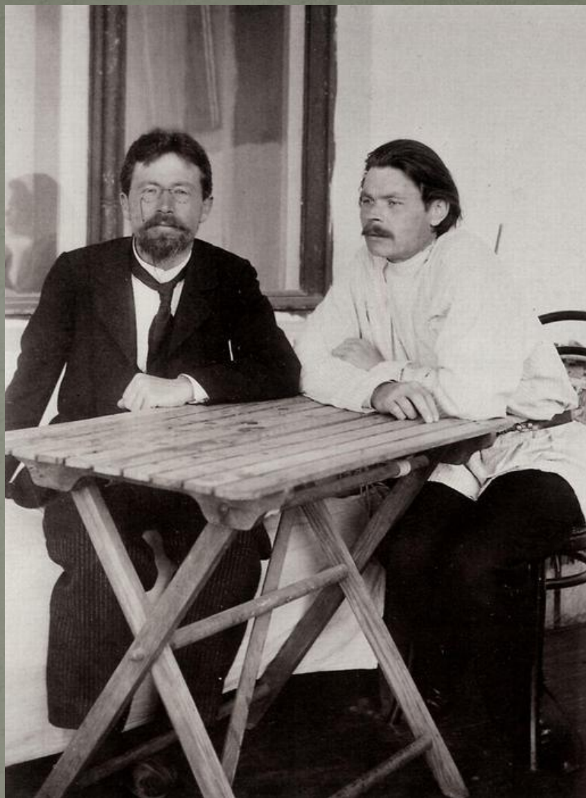
Антон Чехов и Максим Горький