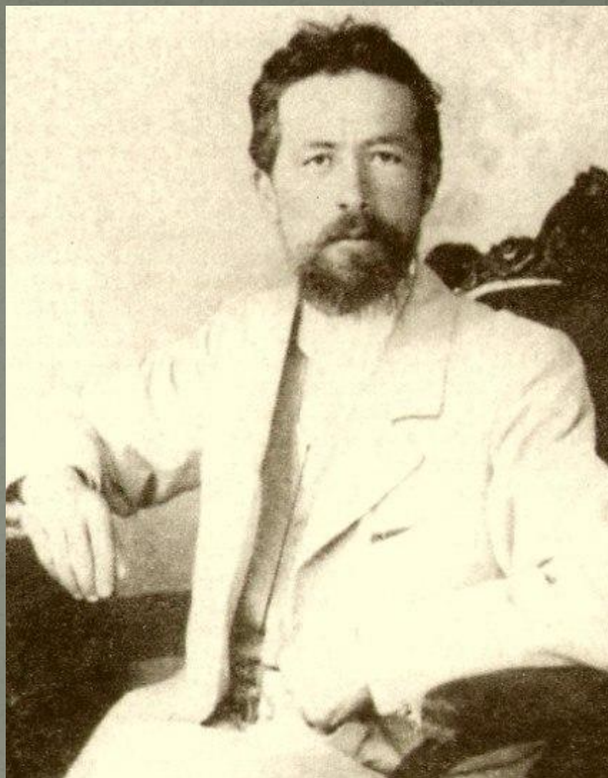
Фото 1898 г., Ялта.