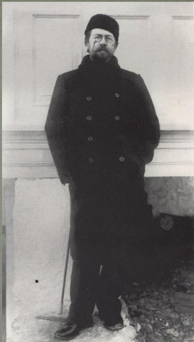
А. П. Чехов. Ялта. 1899 год.