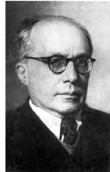
Рубинштейн Сергей Леонидович (1889-1960)

Ядро личности составляют мотивы сознательных действий, но характеризуют личность так же и неосознаваемые тенденции или побуждения.