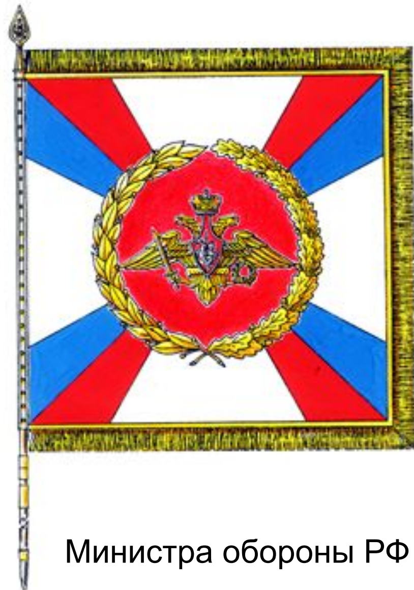
Министра обороны РФ