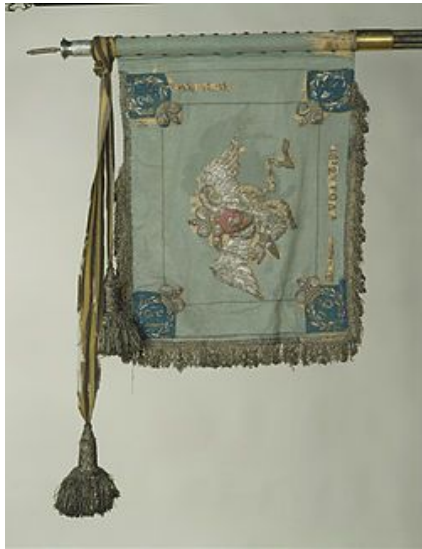
Георгиевский штандарт с Георгиевскими лентами лейб-гвардии Кирасирского Его Величества полка, 1817 год

В качестве знамени с 1731 года в кавалерийских и казачьих частях в российской армии выступал штандарт (нем. Standarte).