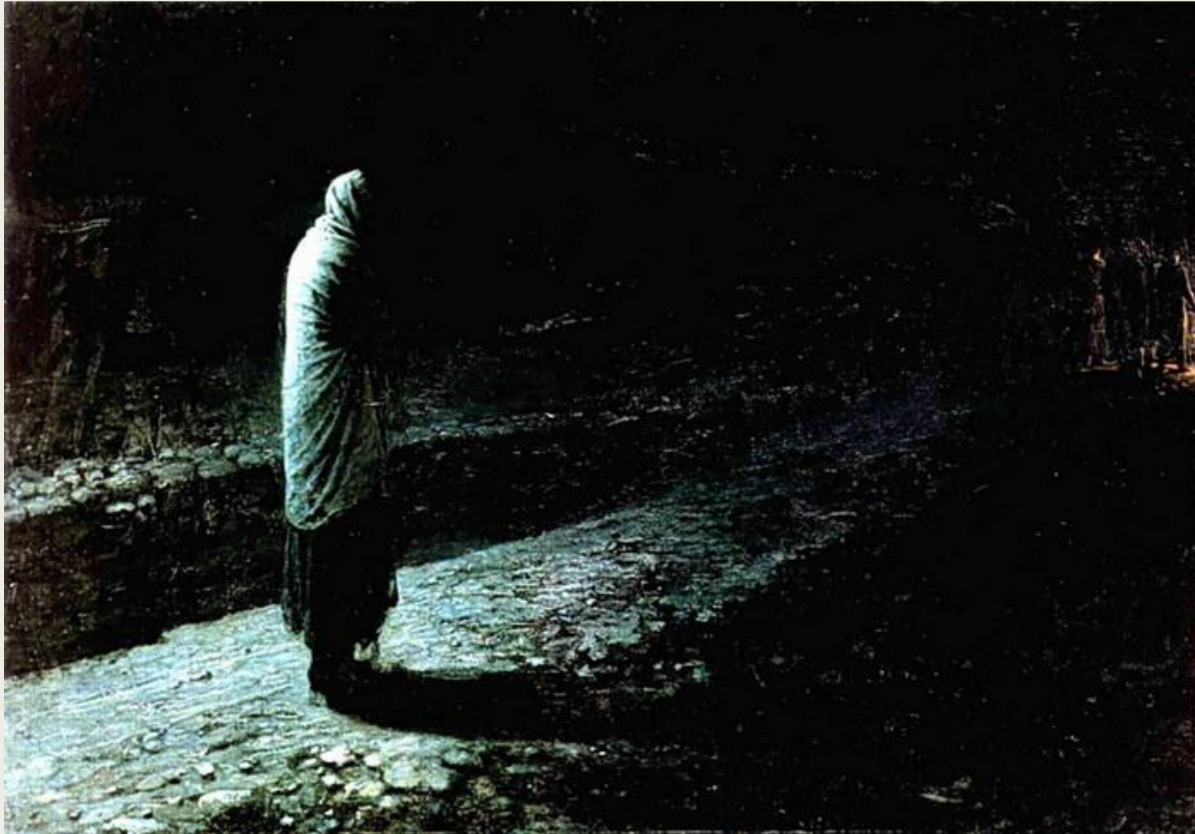
« Совесть. Иуда.» (1891)