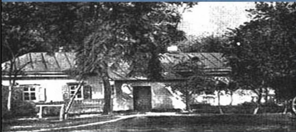
Дом доктора М.Я.Трохимовского в Сорочинцах, где родился Гоголь

Родился в местечке Великие Сорочинцы Миргородского уезда Полтавской губернии в семье помещика. Назвали Николаем в честь чудотворной иконы святого Николая, хранившейся в церкви села Диканька.