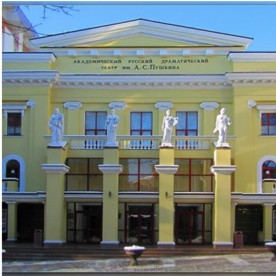
Харківський академічний драматичний театр імені А. С. Пушкіна