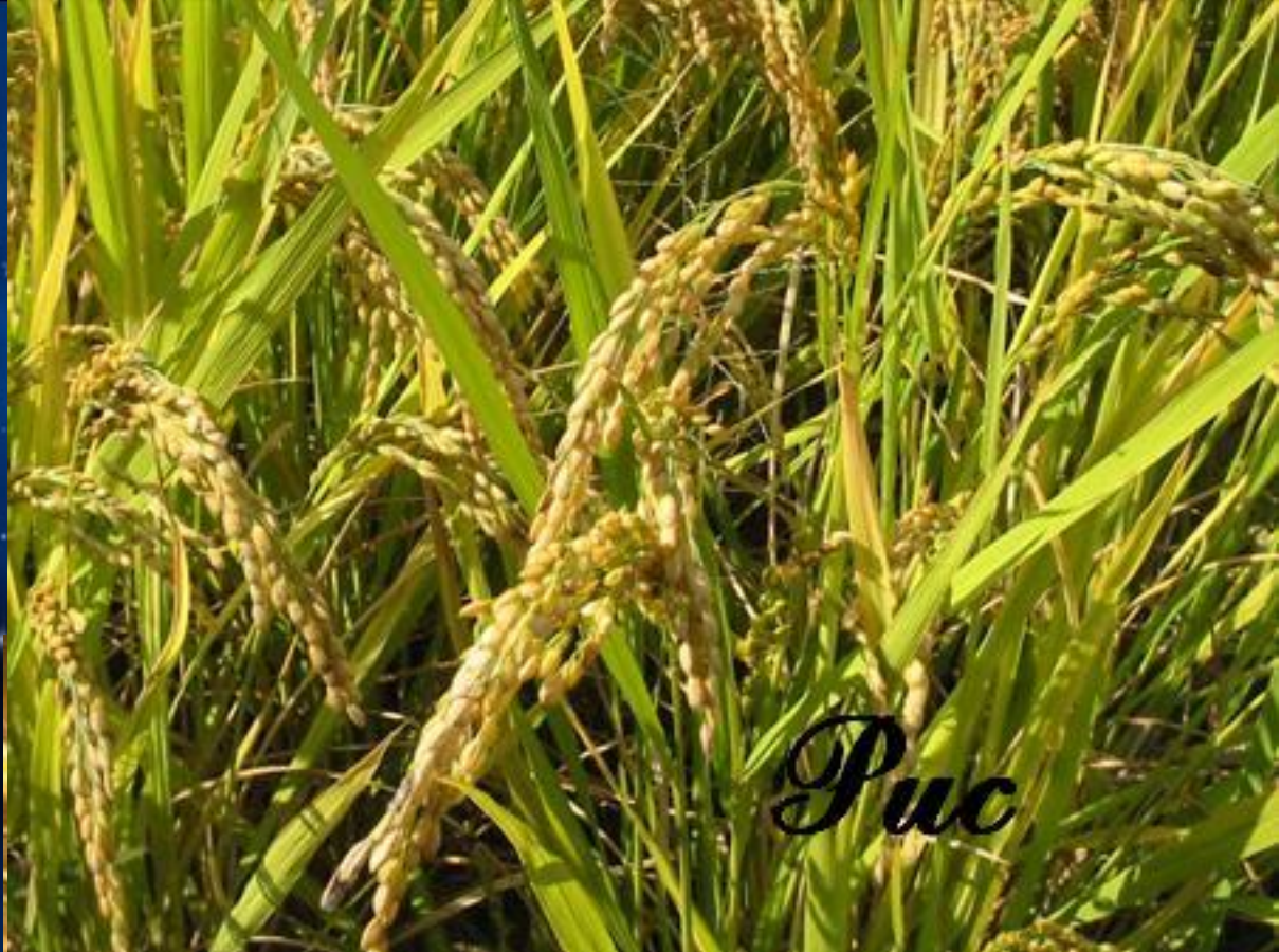
Рис - род однолетних и многолетних трав семейства злаков, зерновая культура. По питательности считается наиболее ценным хлебным растением

Пшеница бывает озимая и яровая. Озимую пшеницу хлеборобы сеют осенью. Молодые растения зимуют под снегом, а весной продолжают развиваться. Яровую пшеницу сеют весной. В конце лета созревает сначала озимая пшеница, а затем яровая.