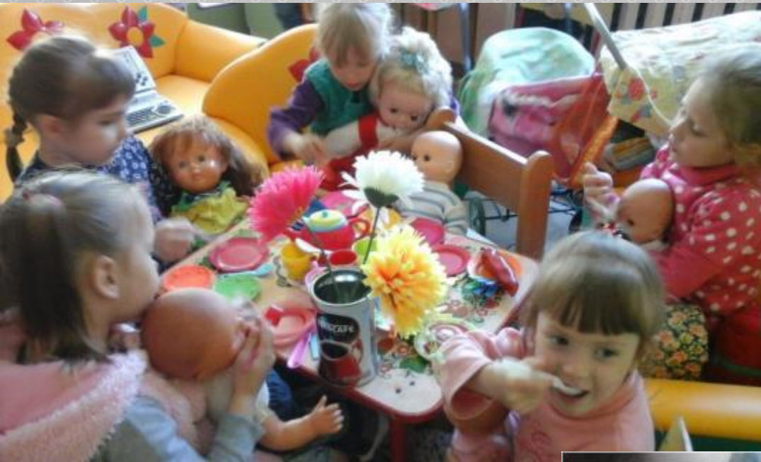
«День рождения дочки»