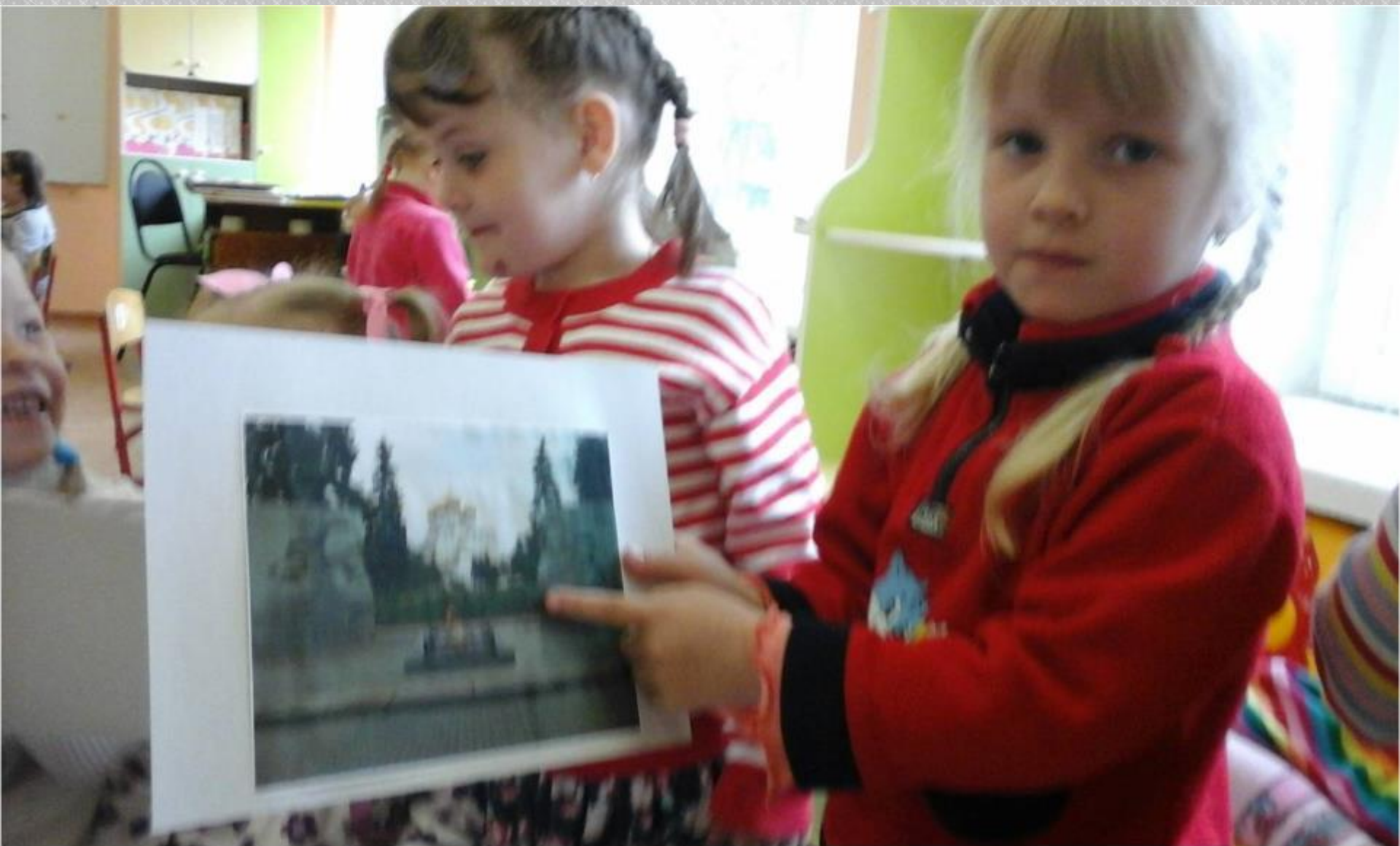
Экскурсия по городу Ярославлю на «автобусе»(по фотографиям и иллюстрациям) Нахождение знакомых мест.