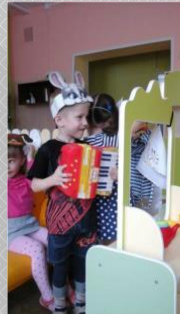
«Т Е Р Е М О К»