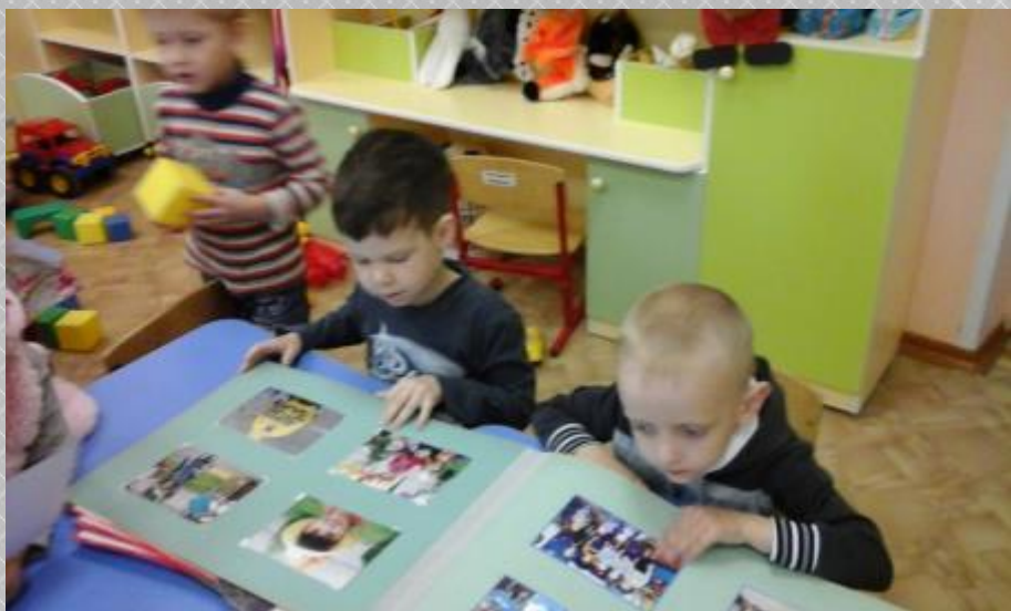
Рассматривание альбома «Дети в садике живут»