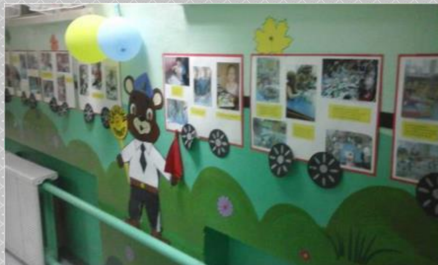
Фото-выставка «Творческие личности»