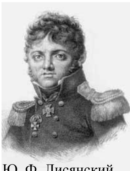
Ю. Ф. Лисянский

1803 г. – первая кругосветная экспедиция