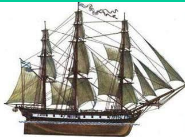
«Восток» (построен в 1818 году в Петербурге, экипаж-117 человек)

В июле 1821 г. корабли возвратились в Кронштадт, привезя огромное количество материалов и коллекций.