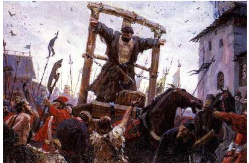
Казнь Степана Разина