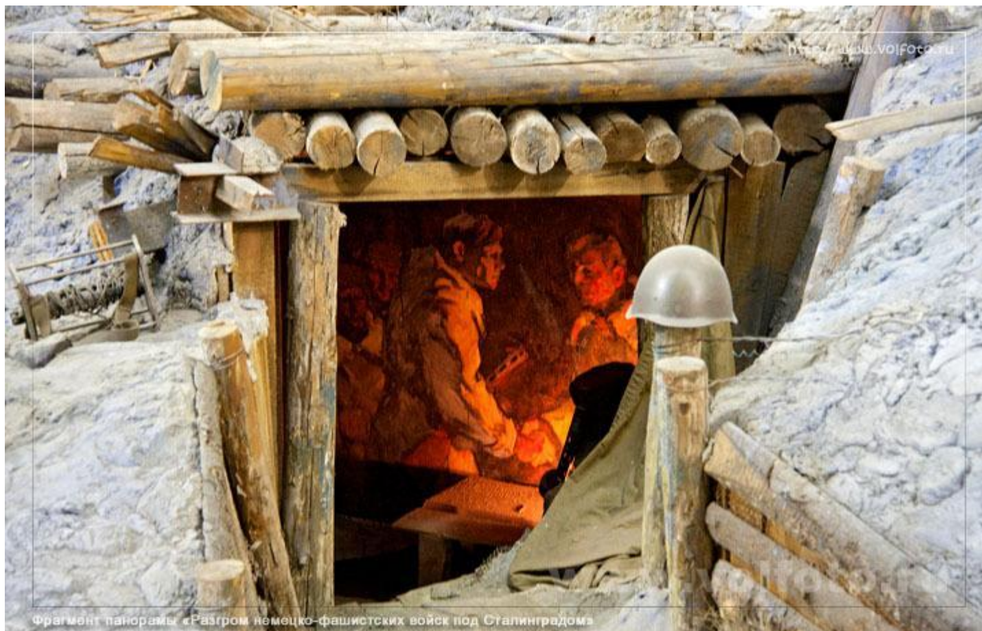
Фрагмент панорамы «Разгром немецко-фашистских войск под Сталинградом»