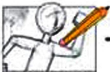
уточнение карандашных набросков