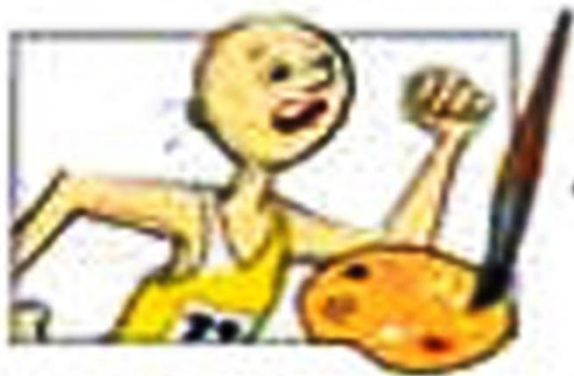
заливка, работа с цветом