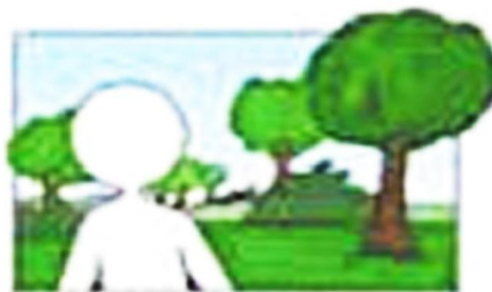
создание фоновых изображений