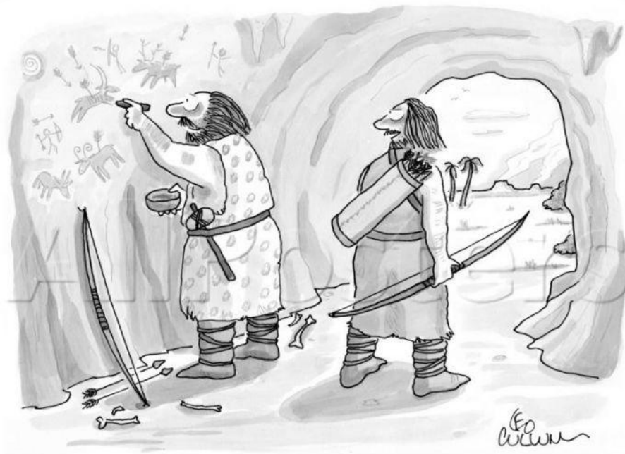
"Enough storyboarding. Let's shoot something."