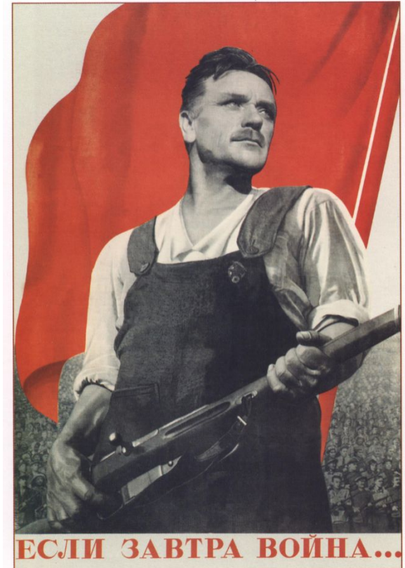
107. Корецкий В. Если завтра война... 1938

Люди впервые остро осознали, что сейчас решается судьба не только советской власти, но и самой страны