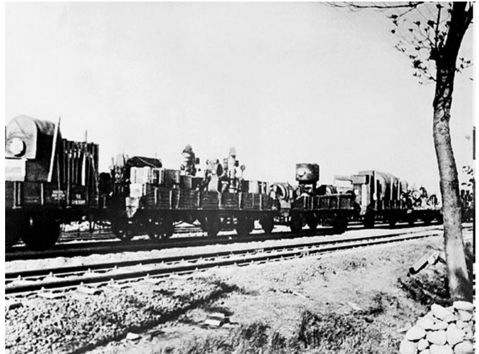
Эвакуация на Восток

Уже за первые пять месяцев войны удалось направить более 1500 крупных промышленных предприятий и свыше 10 млн. человек