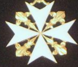
Орден Св. Иоанна Иерусалимского (Мальтийский крест) 1798 г. - 1817 г. Order of St. JOHN of JERUSALEM (ALLAS of MALTA)