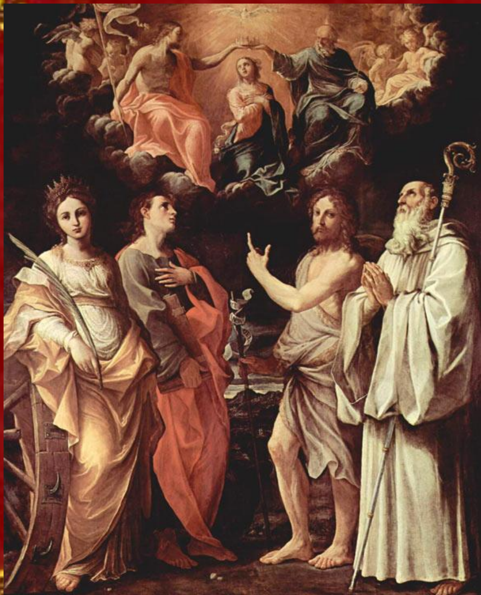
Коронование девы Марии, 1595-1598

У истоков традиции Барокко искусства в живописи стоят два великих итальянских художника - Караваджо и Аннибале Карраччи, создавшие самые значительные работы в последнее десятилетие 16 века - первое десятилетие 17 века. Для итальянской живописи конца 16 века характерны неестественность и стилевая неопределённость. Караваджо и Карраччи своим искусством вернули ей цельность и