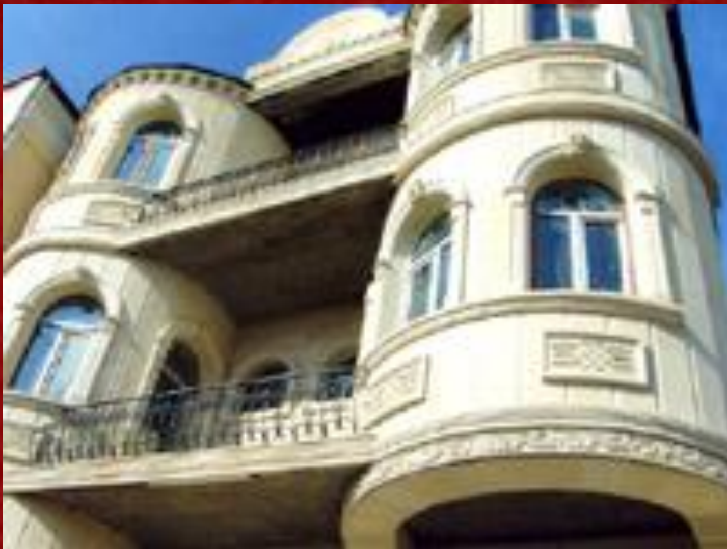
Лепнина на зданиях