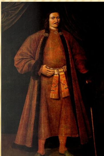
Нарышкин Л.К. - дядя Петра I

В 1682 году, после смерти старшего сводного брата Фёдора Алексеевича, 10-летний Петр и его брат Иван были провозглашены царями. Оба брата, один из-за возраста, другой из-за нездоровья, не могли участвовать в борьбе за власть. И фактически управление взяла на себя их старшая сестра — царевна Софья Алексеевна.