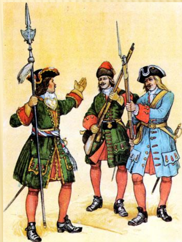
Гвардейцы Преображенского(синего цвета) и Семёновского(зеленого) полков при Петре I

Пётр проявлял большой интерес к религии и наукам, с удовольствием обучался военной премудрости. С 1683 года в селе Преображенском под Москвой юный царь образовал «потешные полки». «Воины» - сверстники царя из семей придворных и окрестная детвора – были одеты в настоящую военную форму. «Потешные полки» стали прототипом новой российской армии, которая была создана по европейским стандартам.