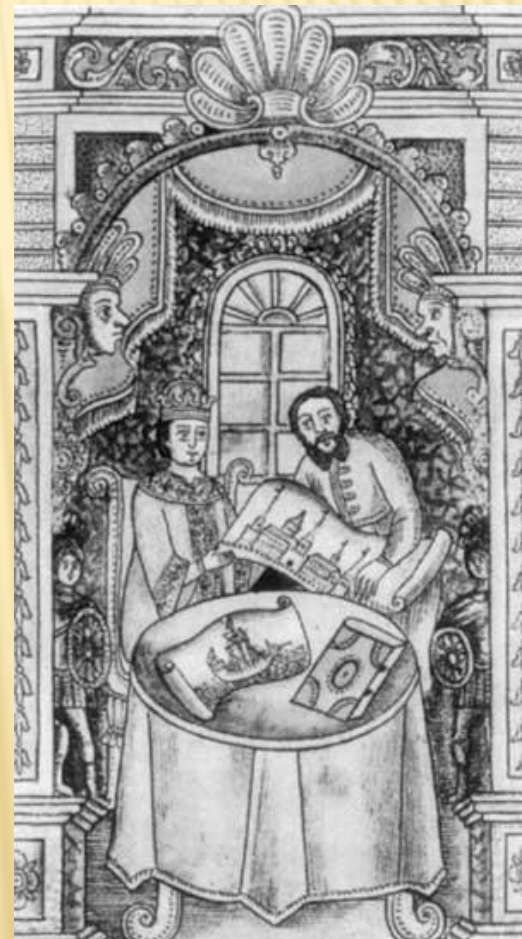
Никита Моисеевич Зотов обучает Петра I

Однако образование будущий царь получил слабое и не отличался грамотностью. Недостатки базового образования Пётр смог впоследствии компенсировать богатыми практическими занятиями.