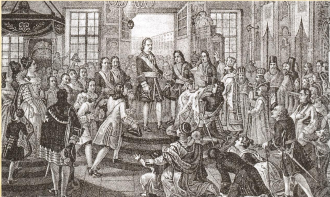
Царь Пётр I принимает титул Отца Отечества, Императора Всероссийского, 1721 год.

После победы в Великой Северной войне, которая позволила расширить территории России в Прибалтийском регионе, Пётр I по прошению сенаторов принял титул Отца Отечества, Императора Всероссийского, Петра Великого в 1721 году.