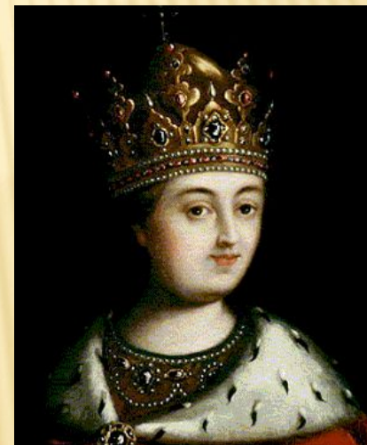
Софья Алексеевна - царевна, старшая сестра Петра I

В 1689 году Софья была отстранена от престола, и власть перешла к Петру I, а управление страной доверено его матери и дяде Л. К. Нарышкину.