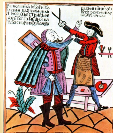
Насильственное бритьё бород.

В образовании также им были проведены ряд реформ, направленные на массовое просвещение: открыто множество школ для детей и первая в России гимназия (1705).