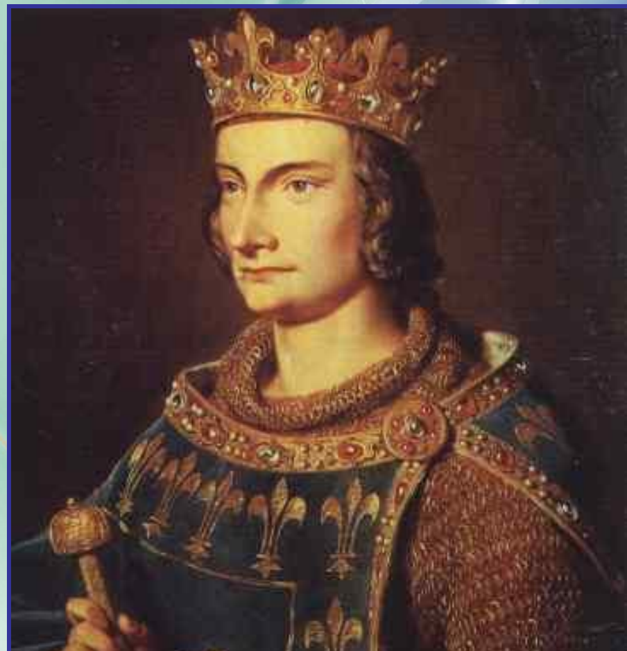
Филипп IV Красивый

При Филиппе IV Красивом было присоединено богатое графство Шампань и лежащая в Пиренейских горах на юге страна Наварра.