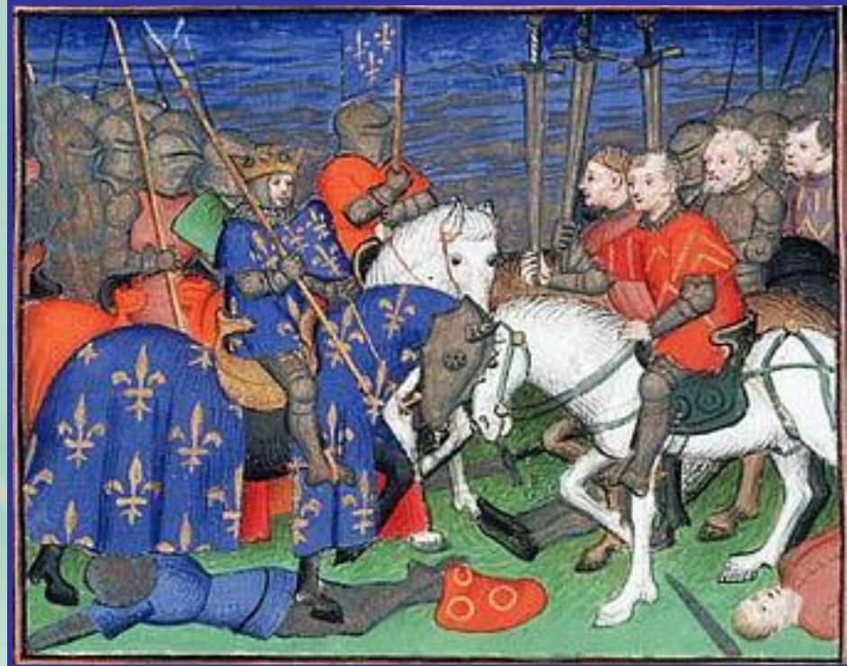
Битва при Бувине

В 1214 году Филипп II в ожесточённой битве при Бувине наголо разгромил своих противников и захватил богатые трофеи. У англичан осталась лишь часть Аквитании.