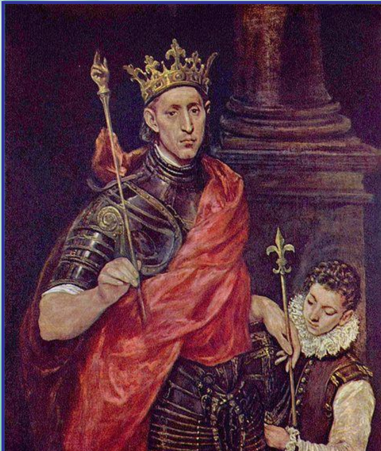
Людовик IX Святой

Король Людовик IX Святой стал сильнее любого феодала Франции. Издавал законы, которые действовали на территории всего государства.