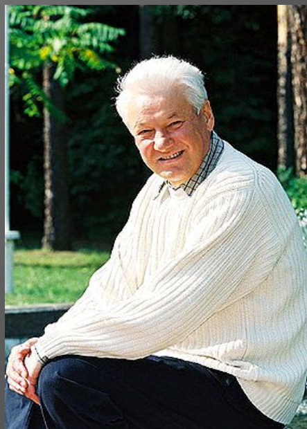
Б.Н.Ельцин Первый Президент РФ июнь 1991- декабрь 1999 гг.