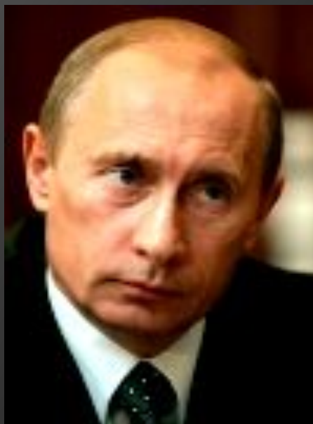
В.В.Путин Второй Президент РФ март 2000- май 2008 гг.;

Четвертый вступил в должность 7 мая 2012 г.