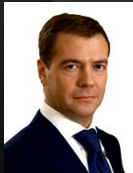
Д.А.Медведев Третий Президент РФ март 2008 – май 2012 гг.

Четвертый вступил в должность 7 мая 2012 г.