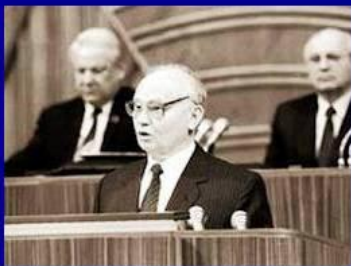
председатель КГБ В.А. Крючков.

Часть высших руководителей Советского Союза восприняла подготовку подписания нового союзного договора как угрозу существованию единого государства и попыталась его предотвратить.