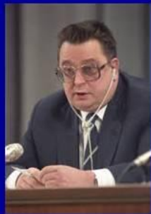
премьер-министр В.С. Павлов