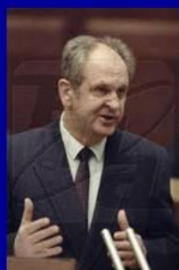
министр внутренних дел Б.К. Пуго