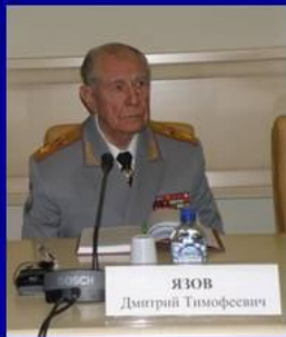
министр обороны Д.Т. Язов