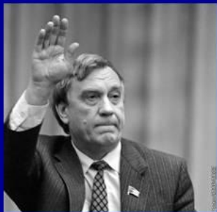
вице-президент СССР Г.И. Янаев