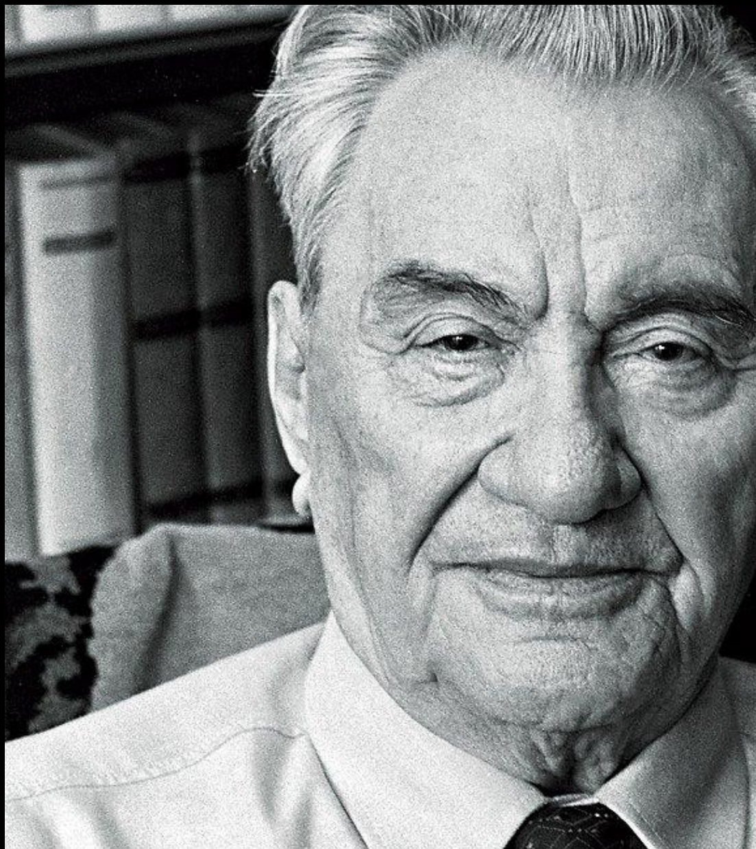
Д. А. Кунаев