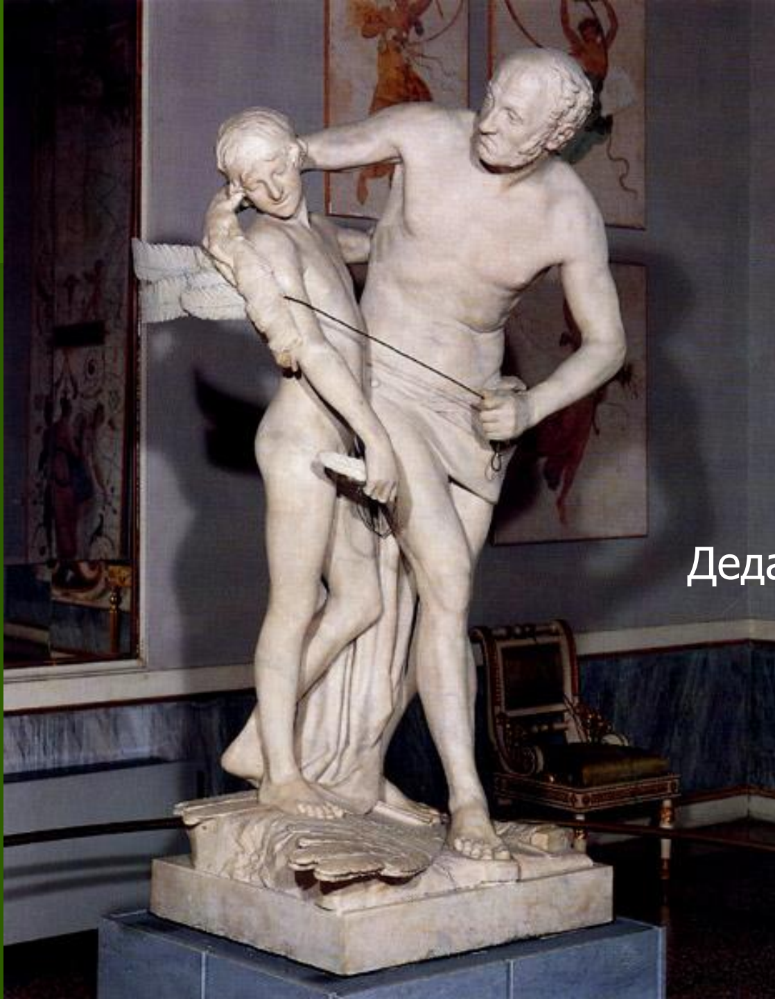
Дедал и Икар