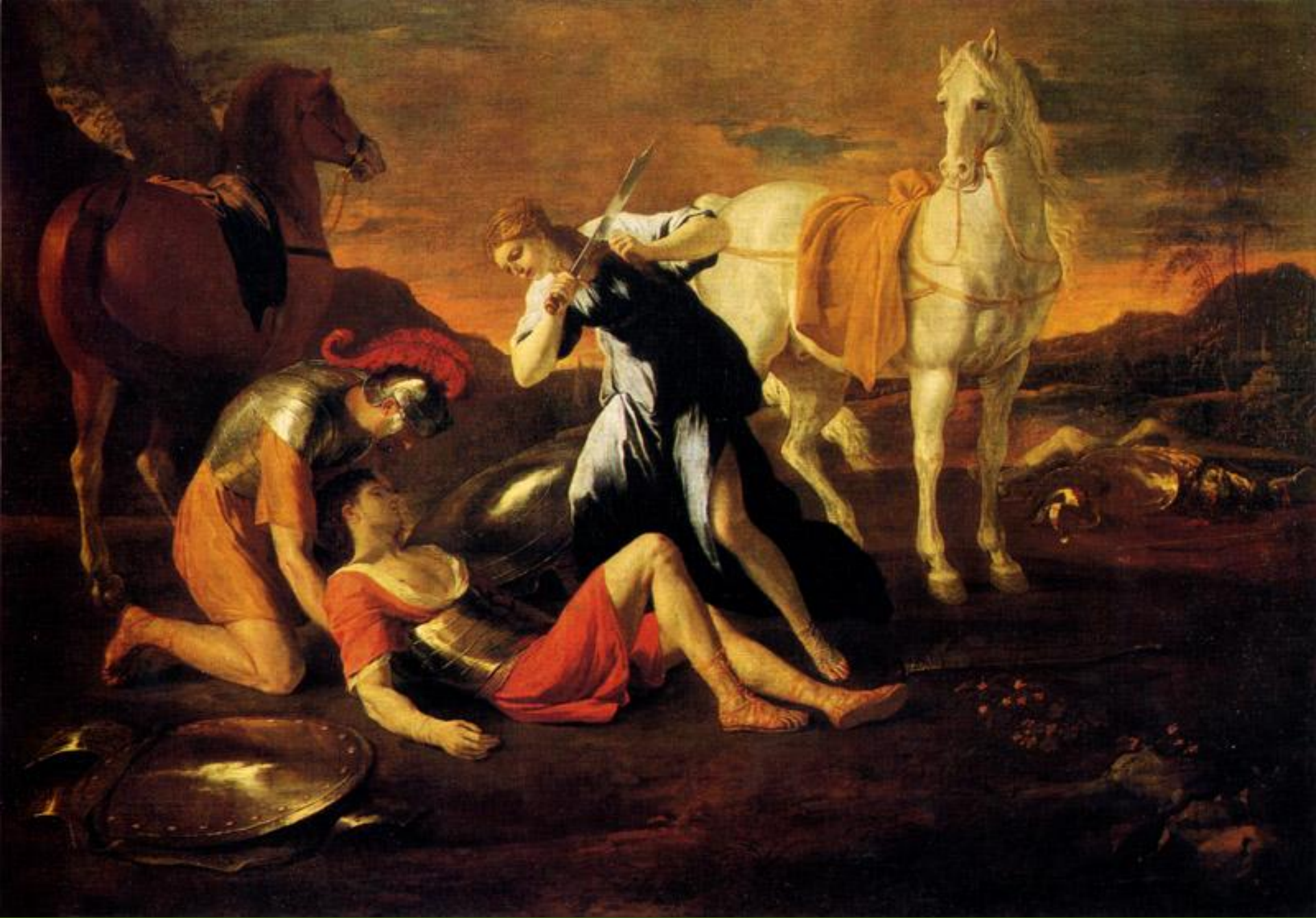
Танкред и Эрминия