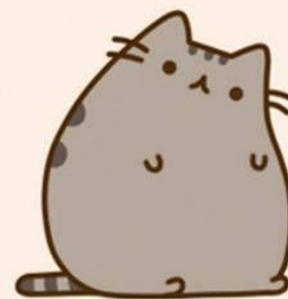
kind of lazy