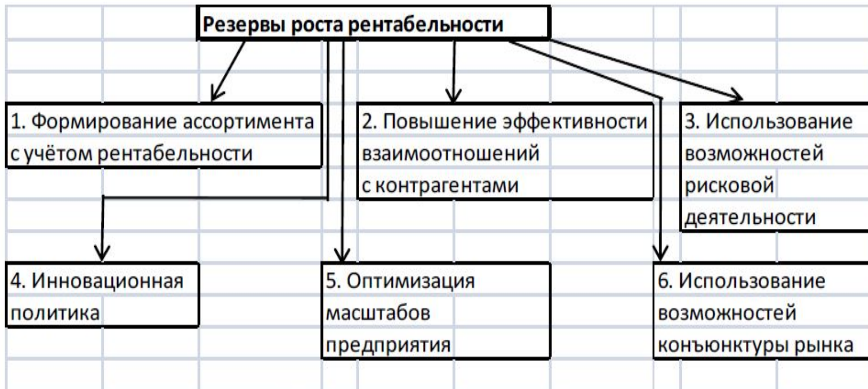
Основные резервы роста рентабельности