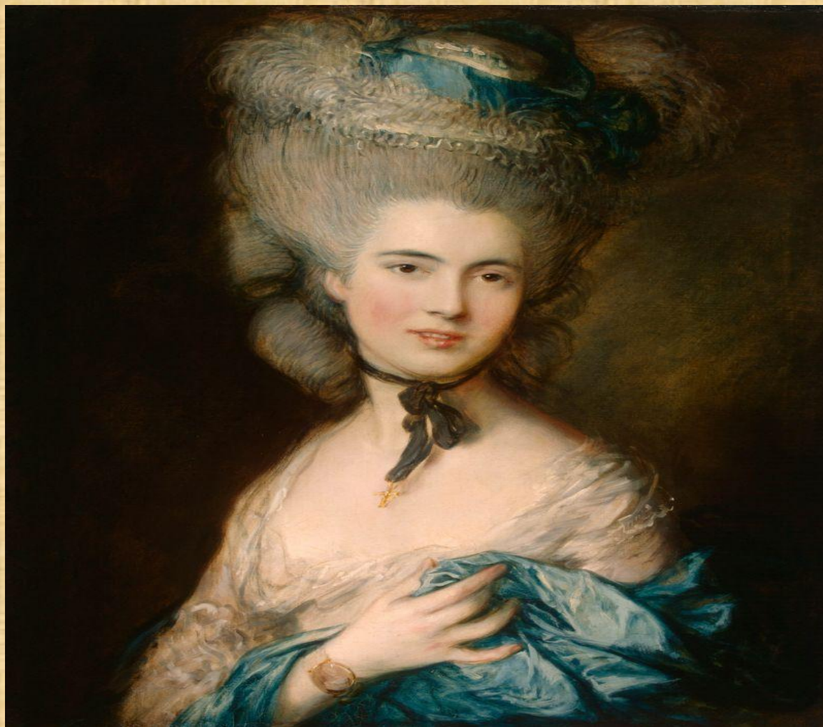
Дама в голубом Гейнсборо , 1778-1782