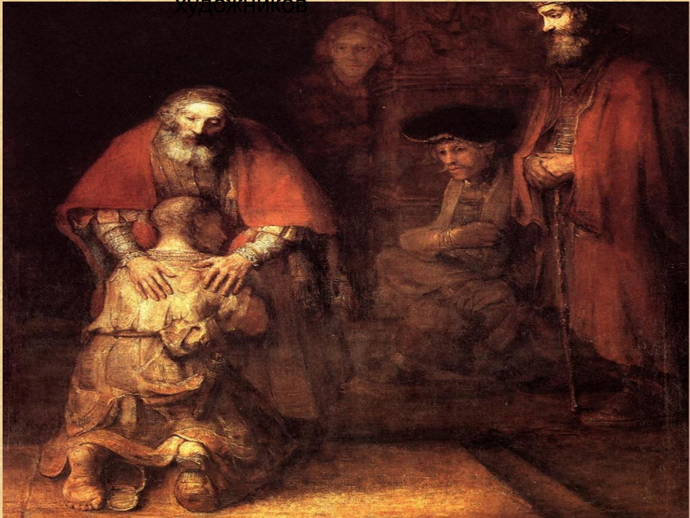
Возвращение блудного сына Рембрандт Харменс ван Рейн, 1600