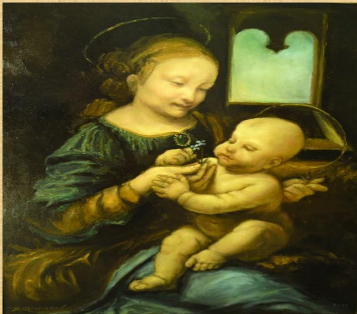
Мадонна с цветком Леонардо да Винчи , 1478-1480