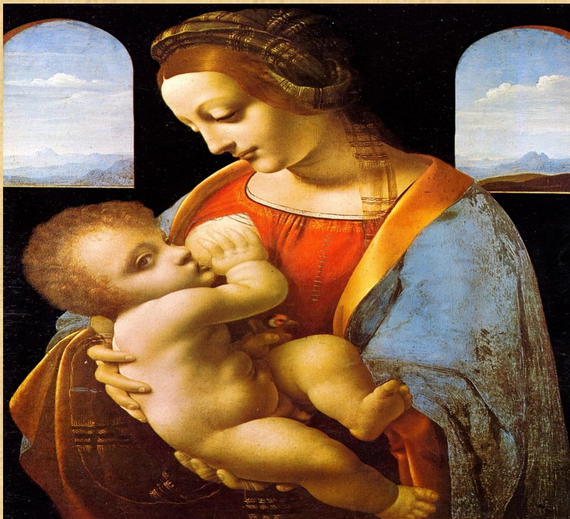
Мадонна с младенцем Леонардо да Винчи , 1490-1491