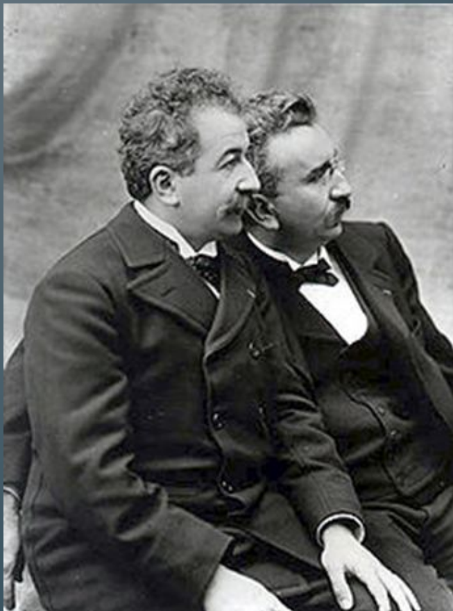
Братья Люмьер (Огюст слева, Луи справа)