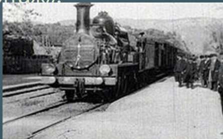
Кадр из фильма Братьев Люмьер «Прибытие поезда на вокзал Ла-Сьота»