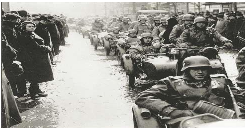
Немецкие войска вступают в Прагу. 15 марта 1939 г.

Агрессивный курс фашистских государств вынудил часть политических кругов западных держав, особенно Франции, искать пути сближения с Советским Союзом. В ноябре 1932 г. между СССР и Францией был заключен договор о ненападении. Он содержал обязательства не вмешиваться во внутренние дела друг друга и не воевать между собой ни при каких обстоятельствах. В 1933 г. по инициативе Франции начались переговоры о заключении соглашения о взаимной помощи между СССР и Францией. В этом же году были установлены дипломатические отношения между СССР и США, а также подписана конвенция об определении агрессора между СССР и рядом европейских стран. Ведя борьбу за создание системы коллективной безопасности в Европе, СССР предложил Франции заключить договор о взаимной помощи с участием других европейских государств. Был выработан проект Восточного пакта , который мог бы создать систему коллективной безопасности в Европе. Однако Германия, Польша и некоторые другие страны отказались от участия в Восточном пакте.