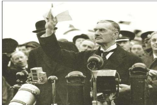
Выступление Н. Чемберлена по возвращении из Мюнхена