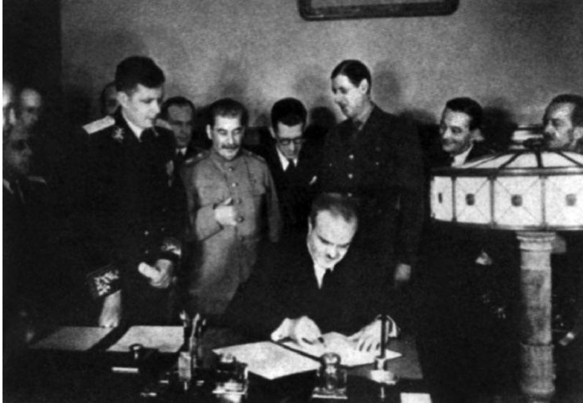
Подписание Советско-Французского договора о взаимной помощи.