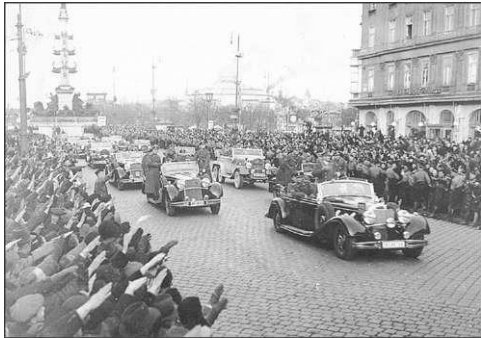
Жители Вены приветствуют германские войска. 1938 г.

получил название « оси (треугольника) Берлин — Рим — Токио ».