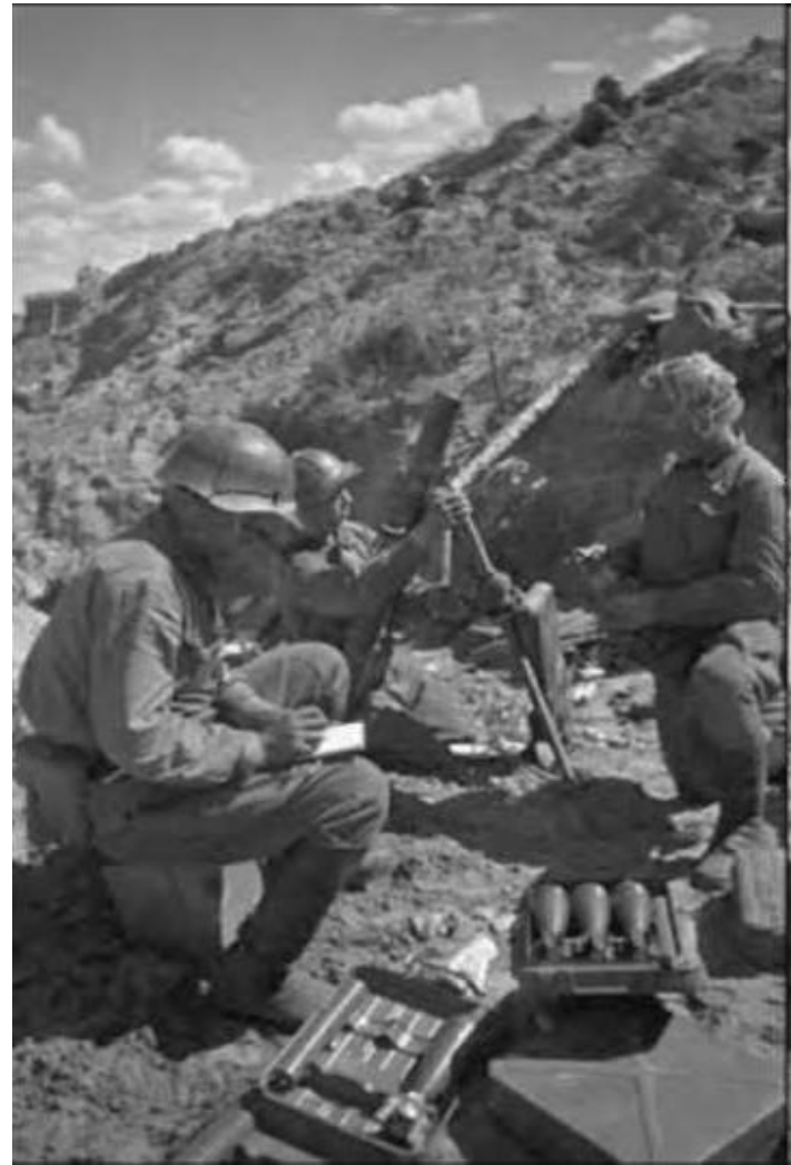
1939г. Бои за Халкин- Гол