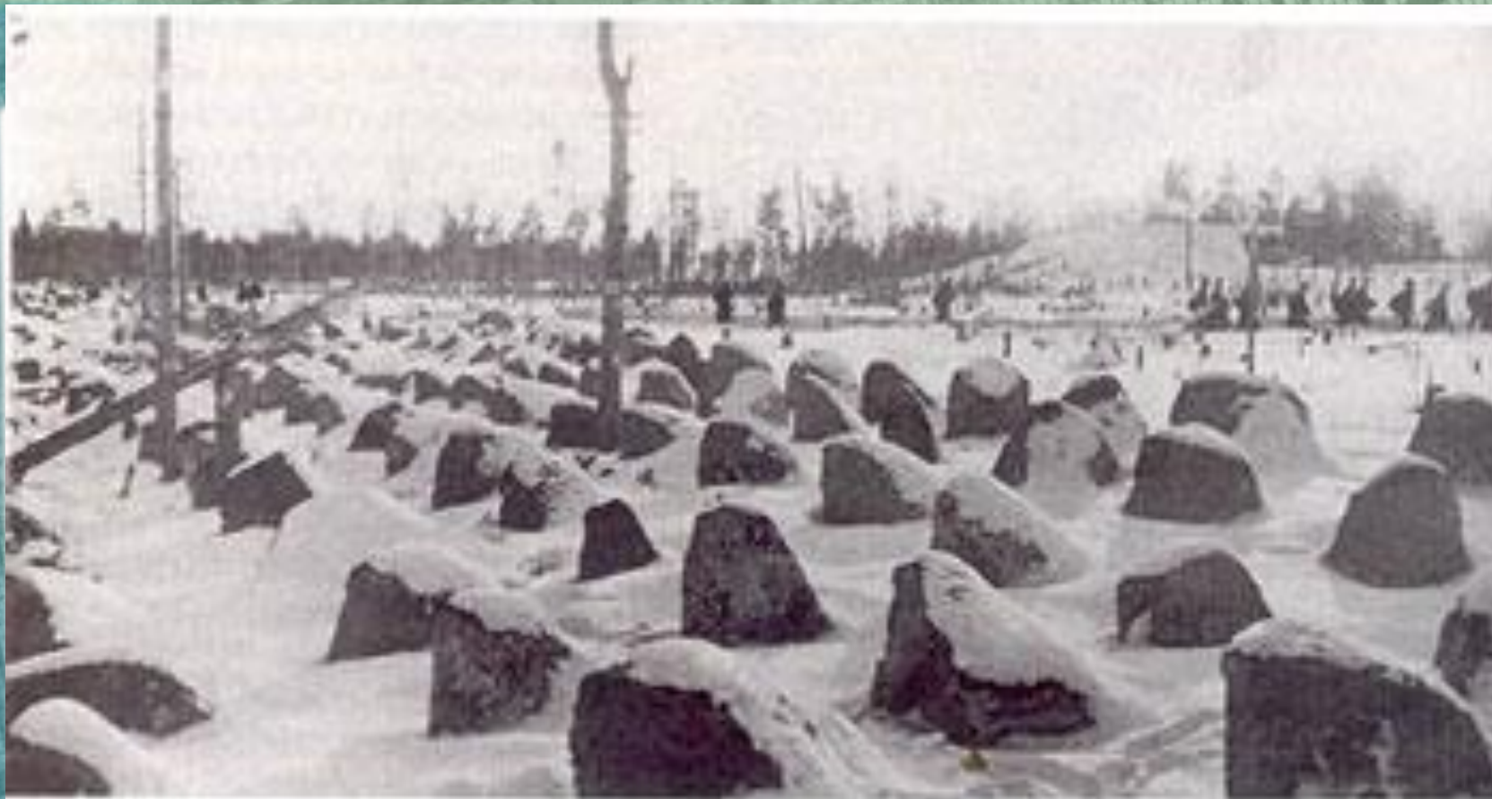
Противотанковые надолбы на линии Маннергейма

К началу осени 1939г. на советско-финской границе финны возвели несколько сотен ДОТов, ДЗОТов, сотни километров траншей, окопов, бетонных надолбов. Так была сформирована