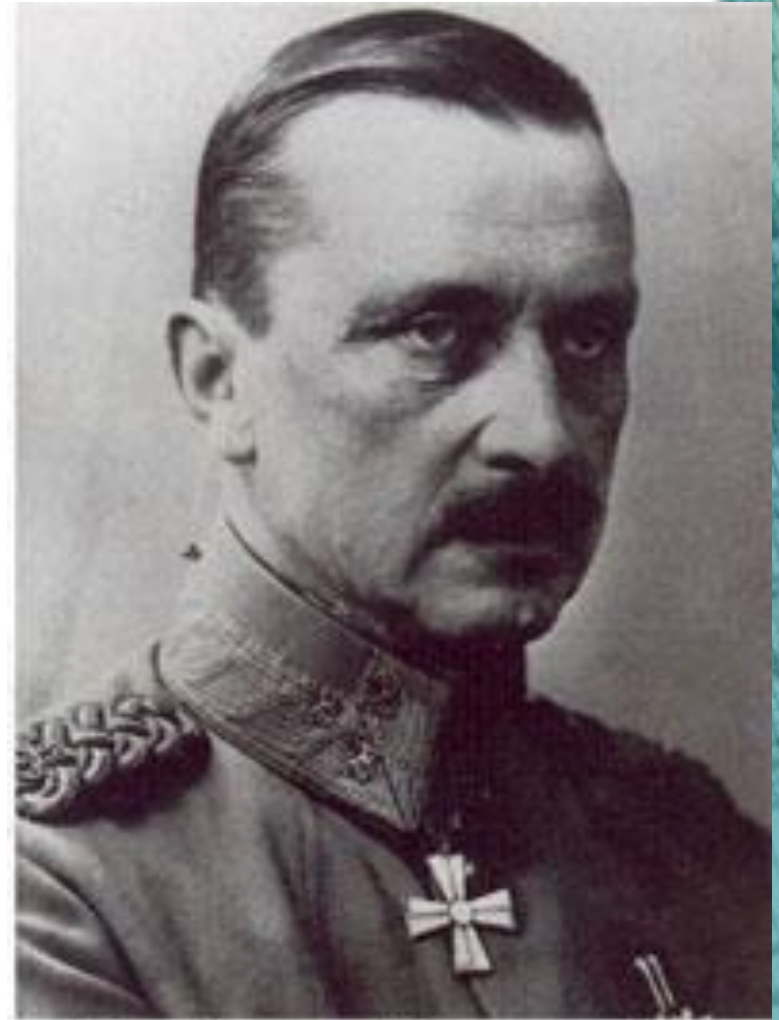
Карл Густав Маннергейм

-отказ со стороны Финляндии и резкое увеличение военных расходов (четверть годового государственного бюджета).