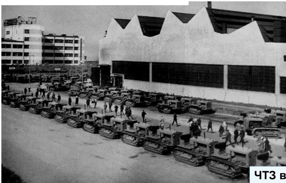
ЧТЗ в конце 30-ых гг.

2. форсировалось строительство так называемых предприятий-дублеров на востоке страны (эти предприятия дублировали те, которые находились в европейской части СССР).