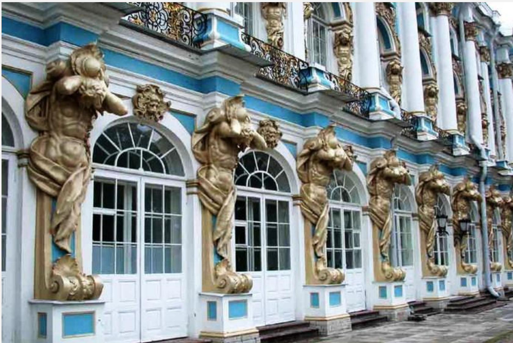
Б.Ф.Растрелли. Атланты. Екатерининский дворец.