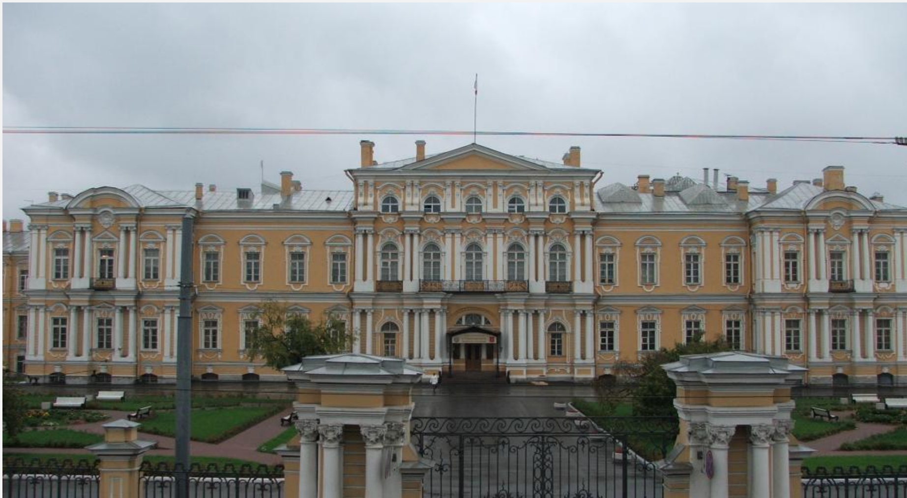
Б. Растрелли. Воронцовский дворец. 1749-1757гг.

В странах католических – барокко пышное, декоративное, торжественное. Бартоломео Растрелли, добавил в него масштабности, монументальности и в то же время жизнерадостности, идущих от теремной традиции раскраски.