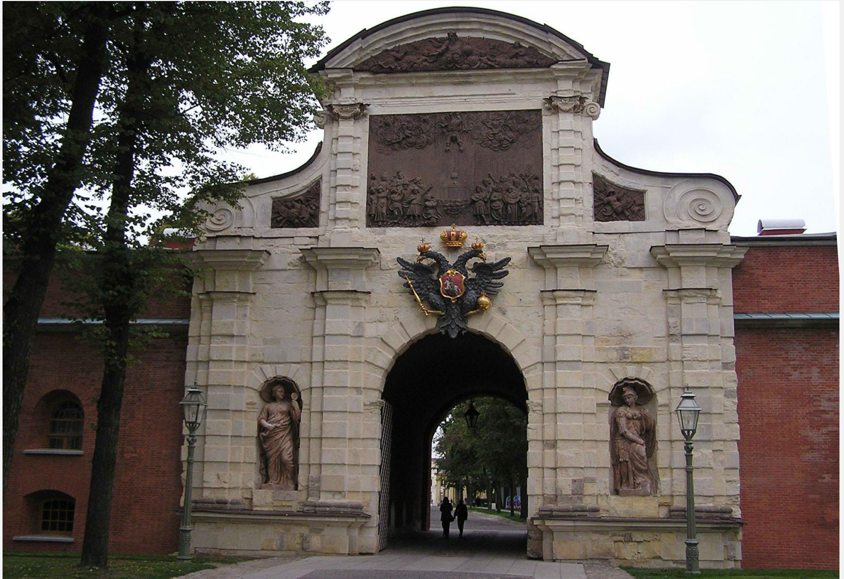
Петровские ворота Петропавловской крепости

Фортификационная и храмовая архитектура отличались простотой и наивным изяществом (колокольня Петропавловского собора, церковь св. Пантелеймона, Петровские ворота Петропавловской крепости и др.).