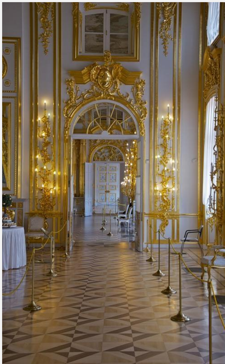
Б.Ф. Растрелли. Анфилада парадных залов Екатерининского дворца.