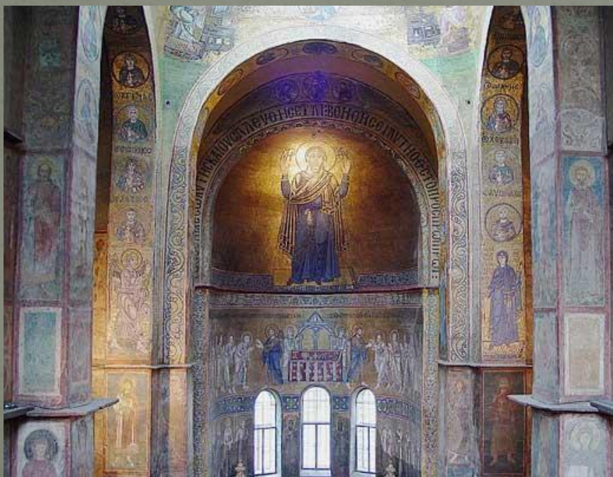
Собор Святой Софии