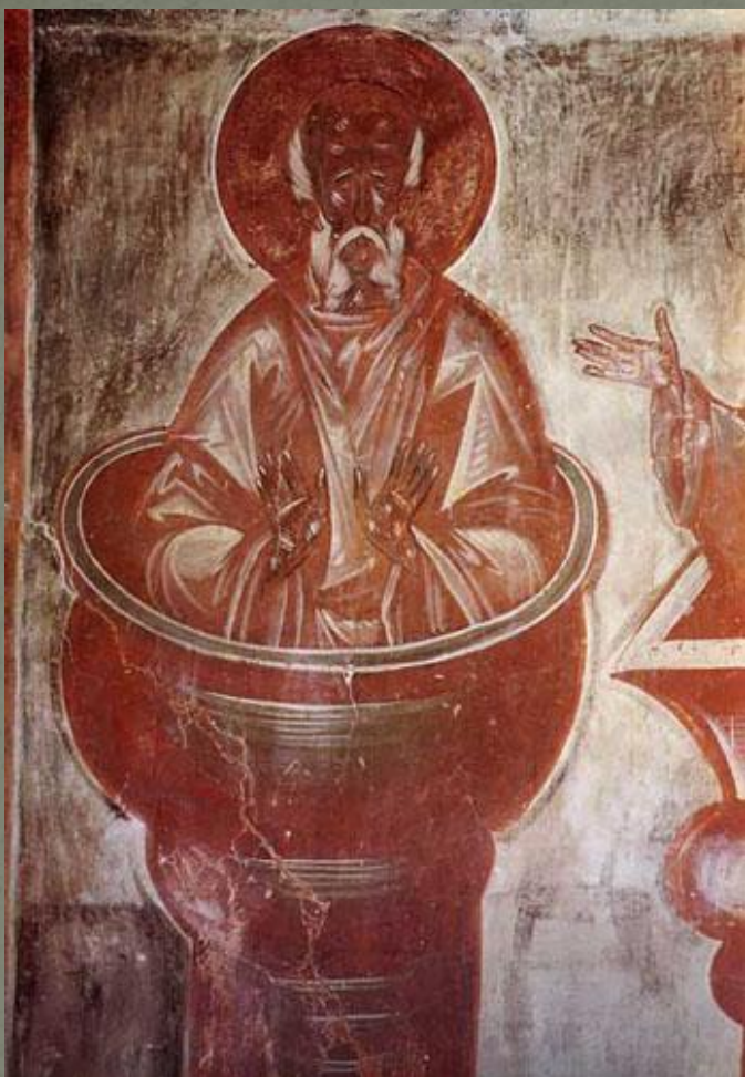
Феофан Грек. столпник. Фреска. 1378 г. Церковь Спаса Преображения. Новгород Великий.