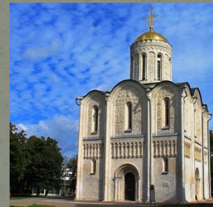
Собор Святого Дмитрия. Рай