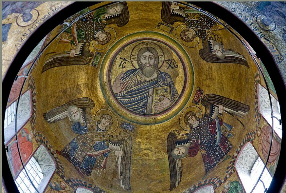
Мозаика в главном куполе собора Святой Софии. XI в.