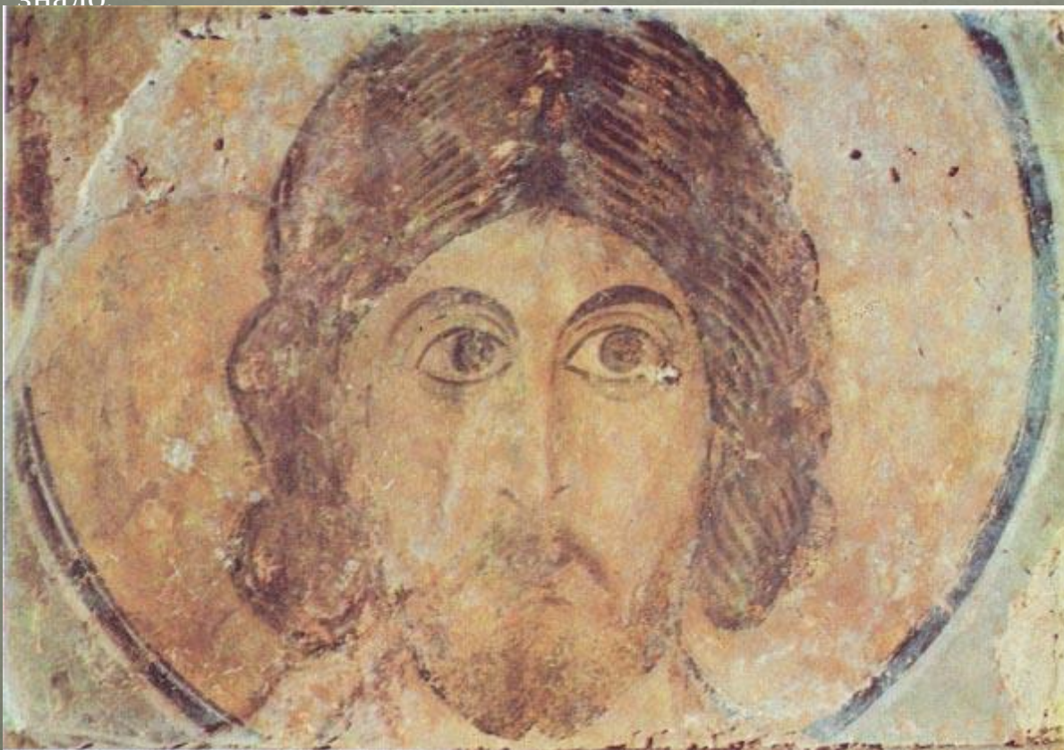
Неизвестный святой. Фрески в соборе Святой Софии. XI в.