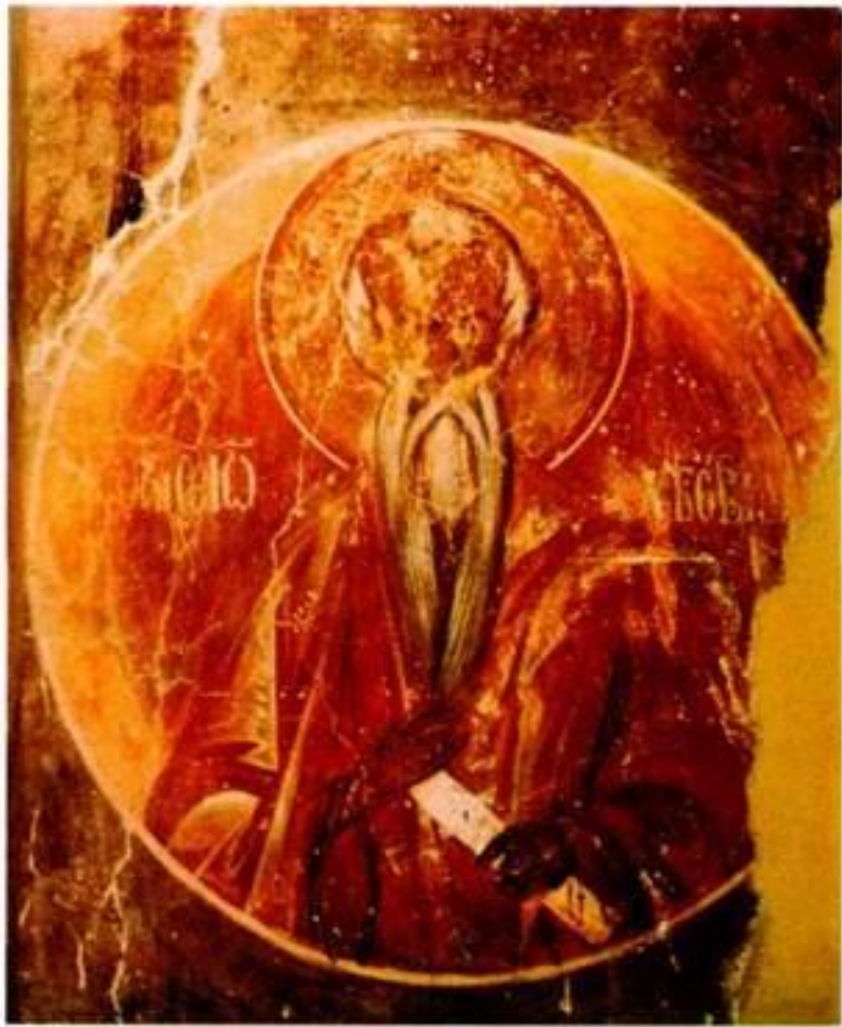
Преподобный Арсений Великий и Иоанн Лествичник. Фреска северной стены в камере на хорах в церкви Спаса Преображения