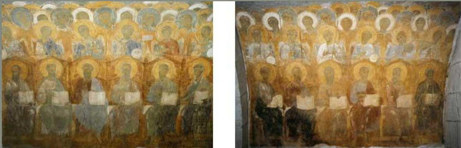
Собор Святого Дмитрия. Страшный суд