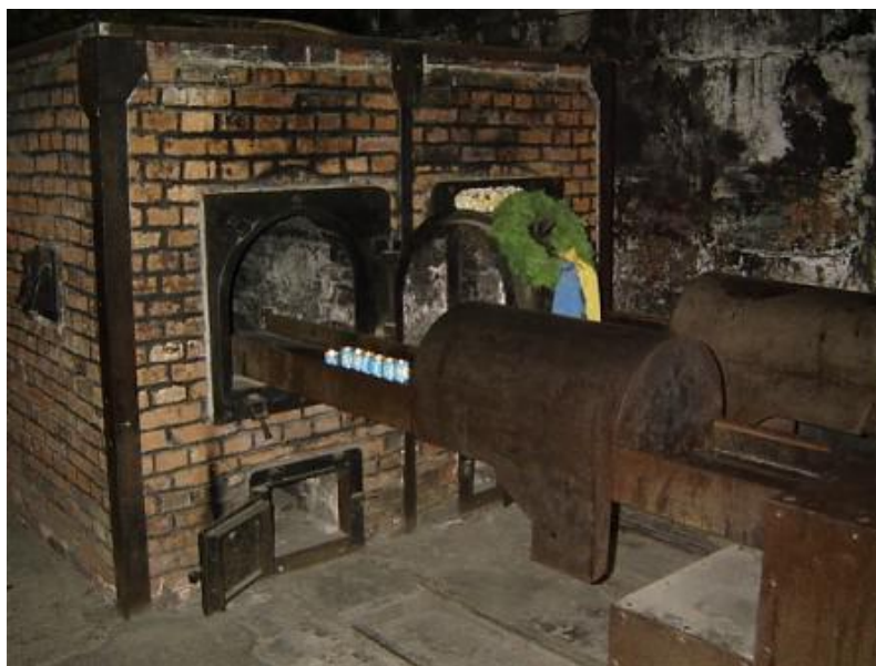
ПЕЧЬ ДЛЯ СЖИГАНИЯ ЛЮДЕЙ

Каждая газовая камера вмещала около 2,5 тысяч человек, они умирали на протяжении 10-15 минут. После этого их трупы переносили в крематории. На их место уже были подготовлены другие узники. Большое количество трупов не всегда могли вместить в себя крематории, поэтому в 1944 году их начали сжигать прямо на улице.