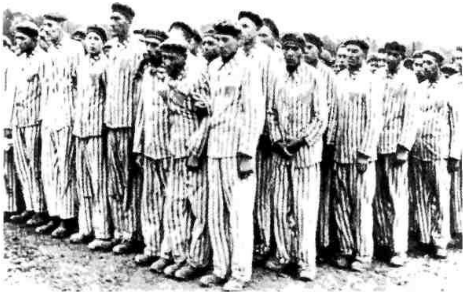
Узники Бухенвальда на построении