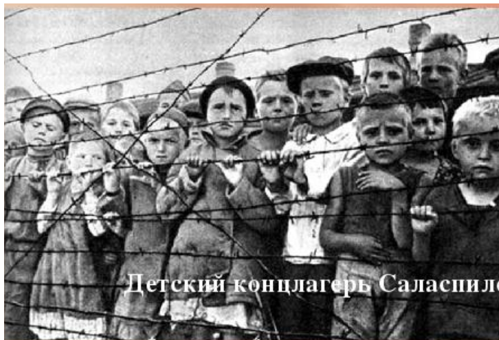
Детский концлагерь Саласпилс

Существовал в 18 километрах от города Риги рядом с городом Саласпилс с октября 1941 года до конца лета 1944 года.