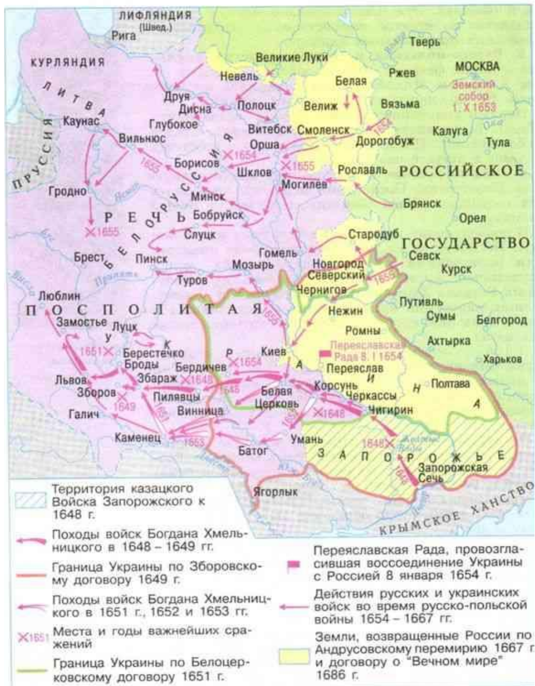
Восстание под предводительством Б. М. Хмельницкого и русско-польская война 1654—1667 гг.