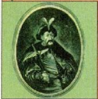
Гетман Украины Богдан Хмельницкий