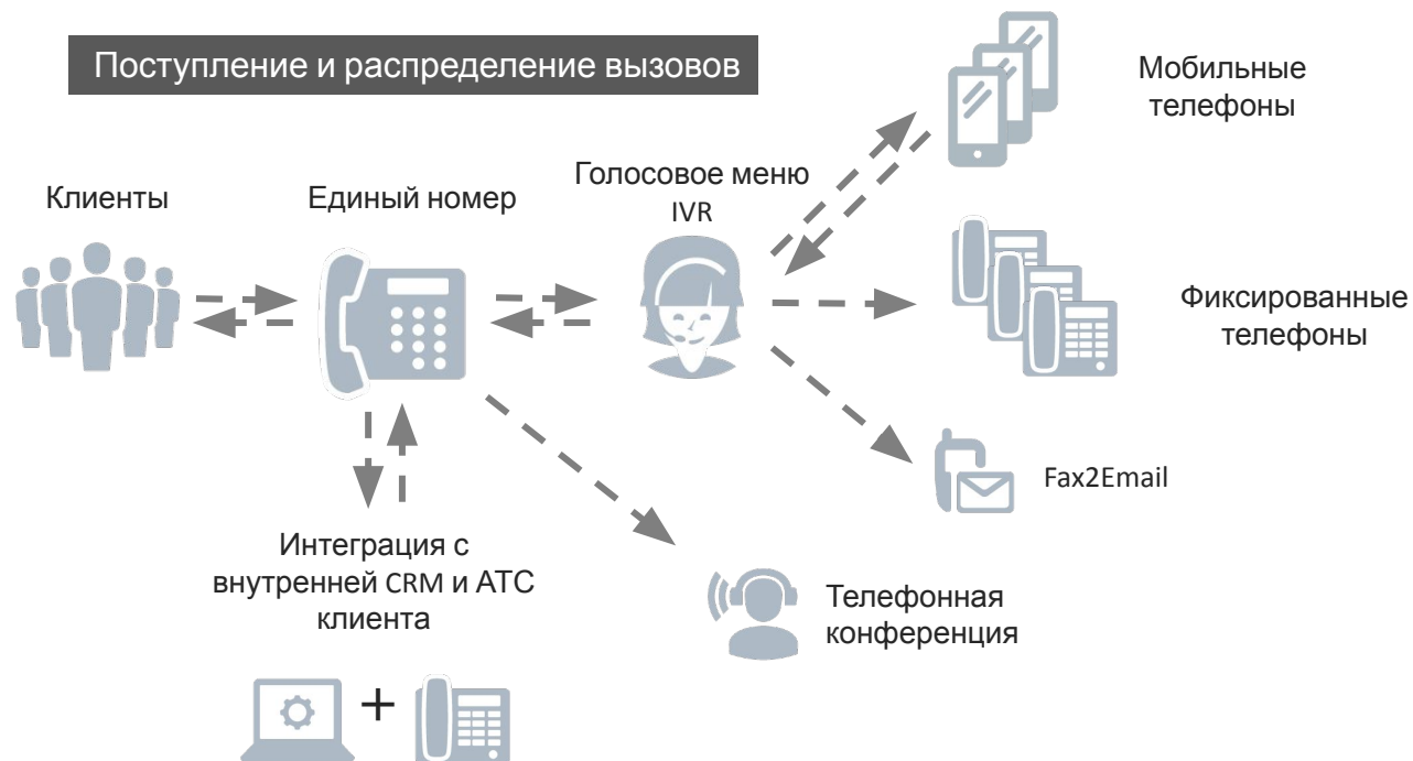
Схема работы услуги