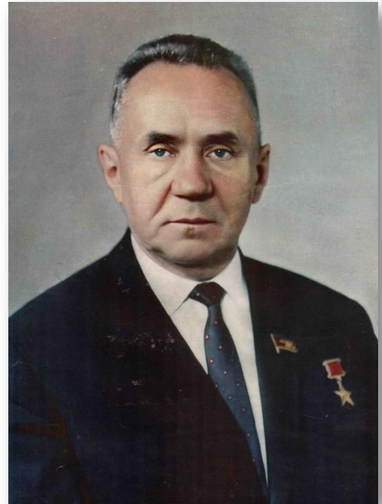
Косыгин Алексей Николаевич – председатель Совета Министров (1964 – 1980гг.)