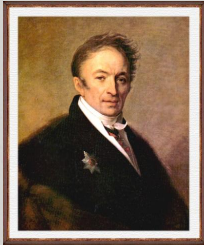
Н. М. Карамзин