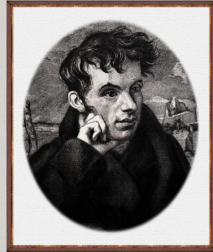
В. А. Жуковский