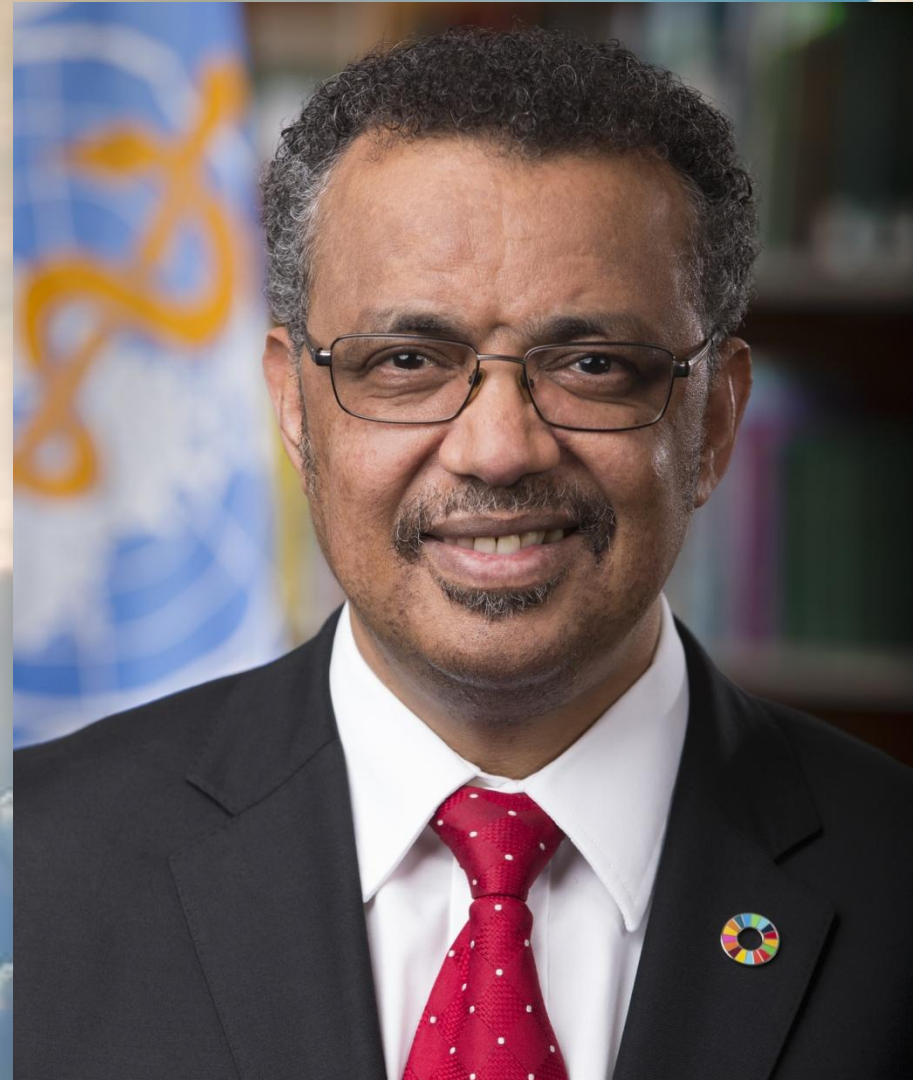
Dr. Tedros Adhanom Ghebreyesus Director General

- este organismul suprem de luare a deciziilor pentru OMS. Se întrunește, de regulă, la Geneva, în fiecare an, la care participă delegații din toate cele 194 de state membre (fiecare stat avînd un singur vot).