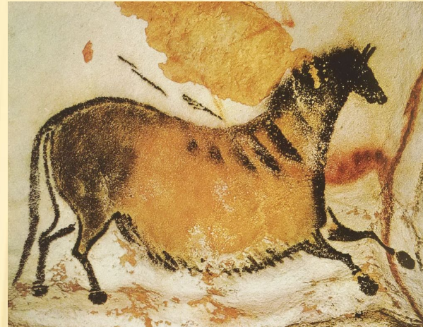
Бегущая лошадь. Пещера Ляско, Франция, 15-9 тыс. лет до н.э.