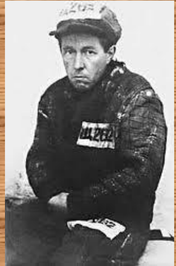
Александр в тюремной форме

На фронте Солженицын продолжал интересоваться общественной жизнью, но стал критически относиться к Сталину (за «искажение ленинизма»). И в августе направлен в лагерь в Новый Иерусалим, 9 сентября 1945 года переведён в лагерь в Москве, заключённые которого занимались строительством жилых домов на Калужской заставе, 9 июля 1947 года переведен на «на шарашку» в Марфине. Позже был этапирован в Бутырскую тюрьму, откуда в августе был направлен в Степлаг — в особый лагерь в Экабастузе. Почти треть своего срока заключения — с августа 1950 по февраль 1953 года — Александр Исаевич отбыл на севере Казахстана. В лагере был на общих работах, некоторое время — бригадиром, участвовал в забастовке. Позднее лагерная жизнь получит литературное воплощение в рассказе «Один день Ивана Денисовича». Официально освобождён 13 февраля 1953