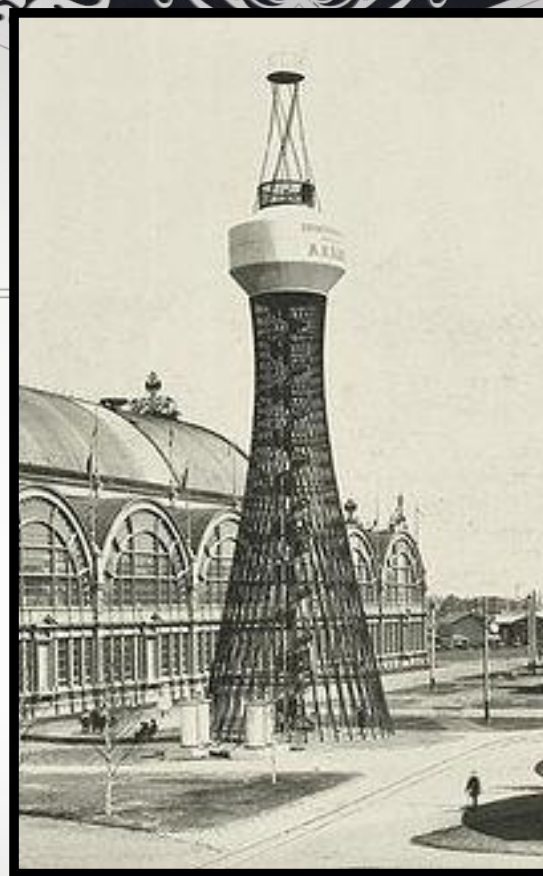
Первая в мире гиперболоидная башня Шухова