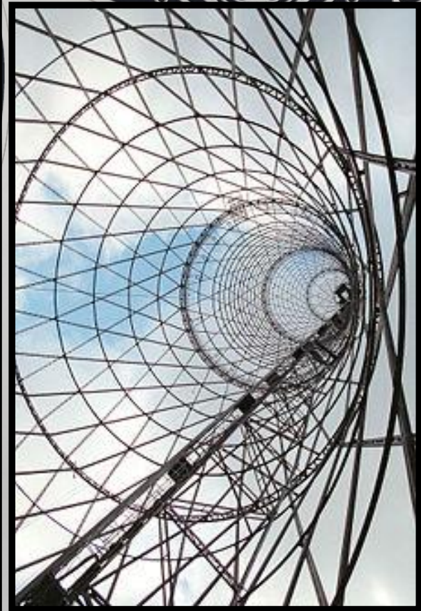
Шуховская башня на Шаболовке в Москве