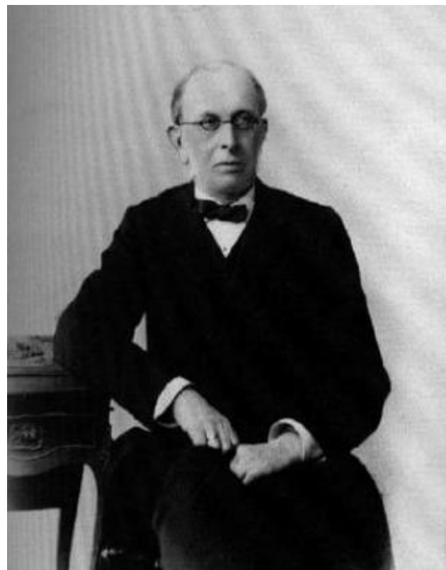
Победоносцев Константин Петрович Обер-прокурор Синода