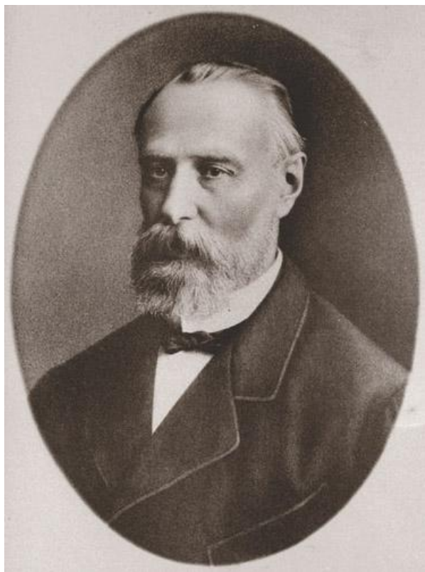
Катков Михаил Никифорович Редактор «Московских ведомостей»