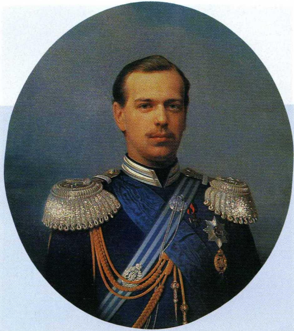
С. К. Заряно. Портрет цесаревича Александра Александровича. 1867 г.

В июне 1866 г. состоялась помолвка цесаревича Александра и принцессы Дагмар, которая затем перешла в православие и получила имя Марии Фёдоровны.