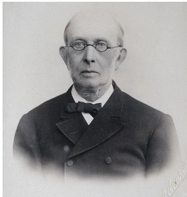
Константин Петрович Победоносцев