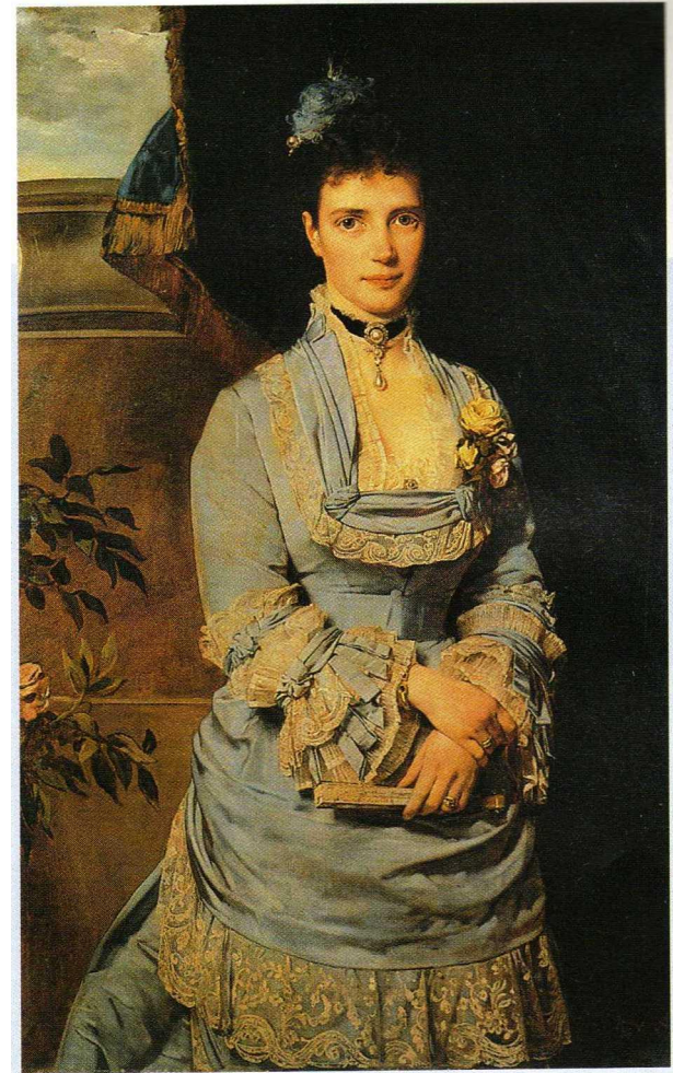
Генрих фон Ангели. Портрет великой княгини Марии Федоровны. 1874 г.

В июне 1866 г. состоялась помолвка цесаревича Александра и принцессы Дагмар, которая затем перешла в православие и получила имя Марии Фёдоровны.