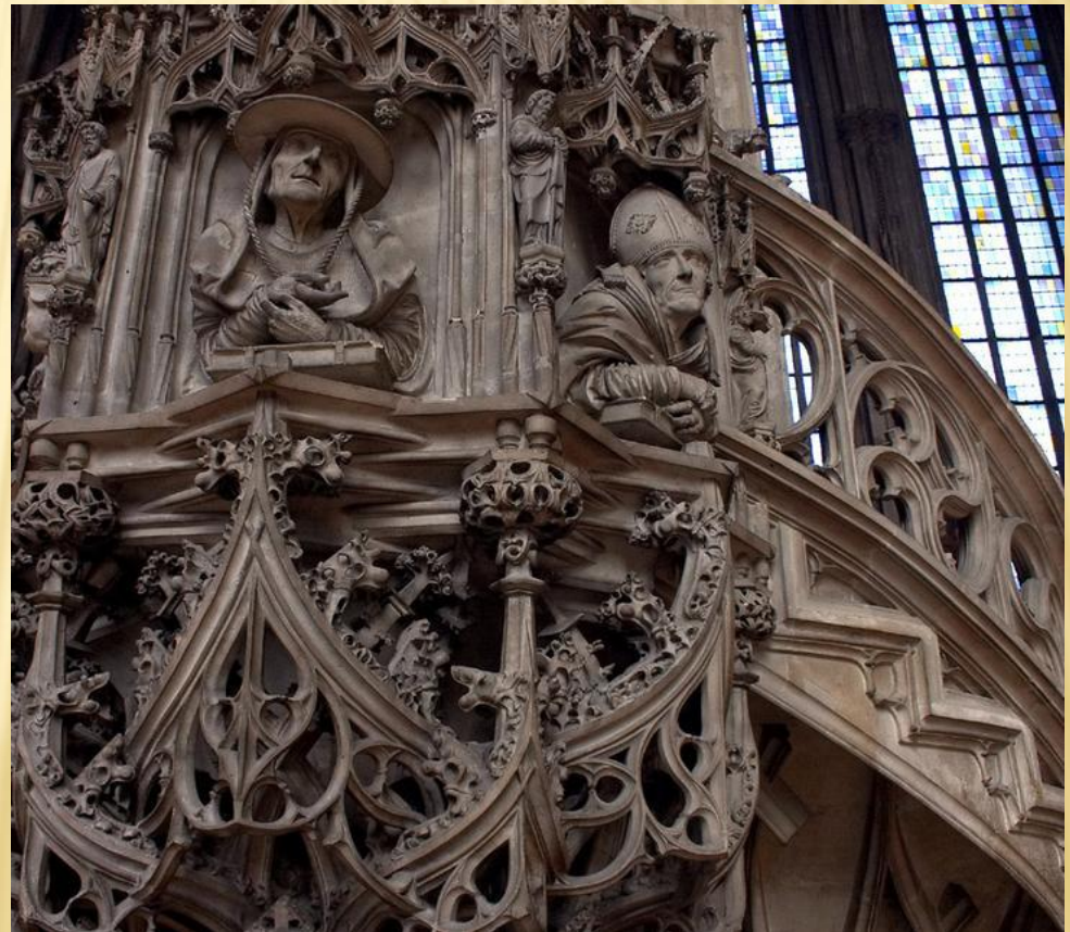
Резьба по камню XVI века

а. Резьба по камню - процесс придания камню требуемой формы и внеш. отделки при помощи распиловки, токарной обработки, сверления, шлифовки, полировки, гравировки (резцом, ультразвуком).