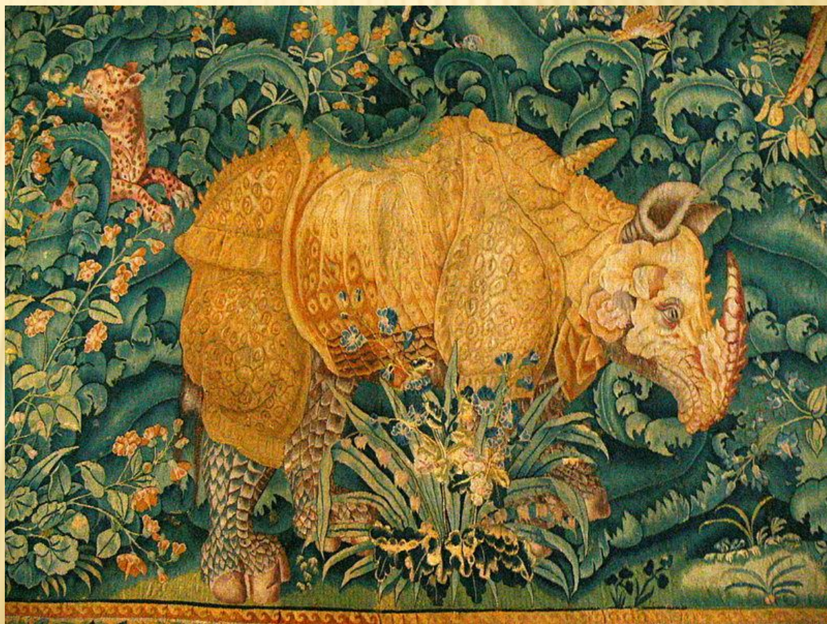
Носорог. Фландрия. 1550. Замок Кронборг

2. Гобелён (фр. gobelin ), или шпалера , — один из видов декоративно-прикладного искусства, стенной односторонний безворсовый ковёр с сюжетной или орнаментальной композицией, вытканый вручную перекрёстным переплетением нитей.